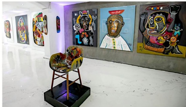
■ La exposición "Naturaleza No Muerta" estará disponible cerca de cuatro meses.

Las piezas realizadas en distintos formatos se agrupan bajo