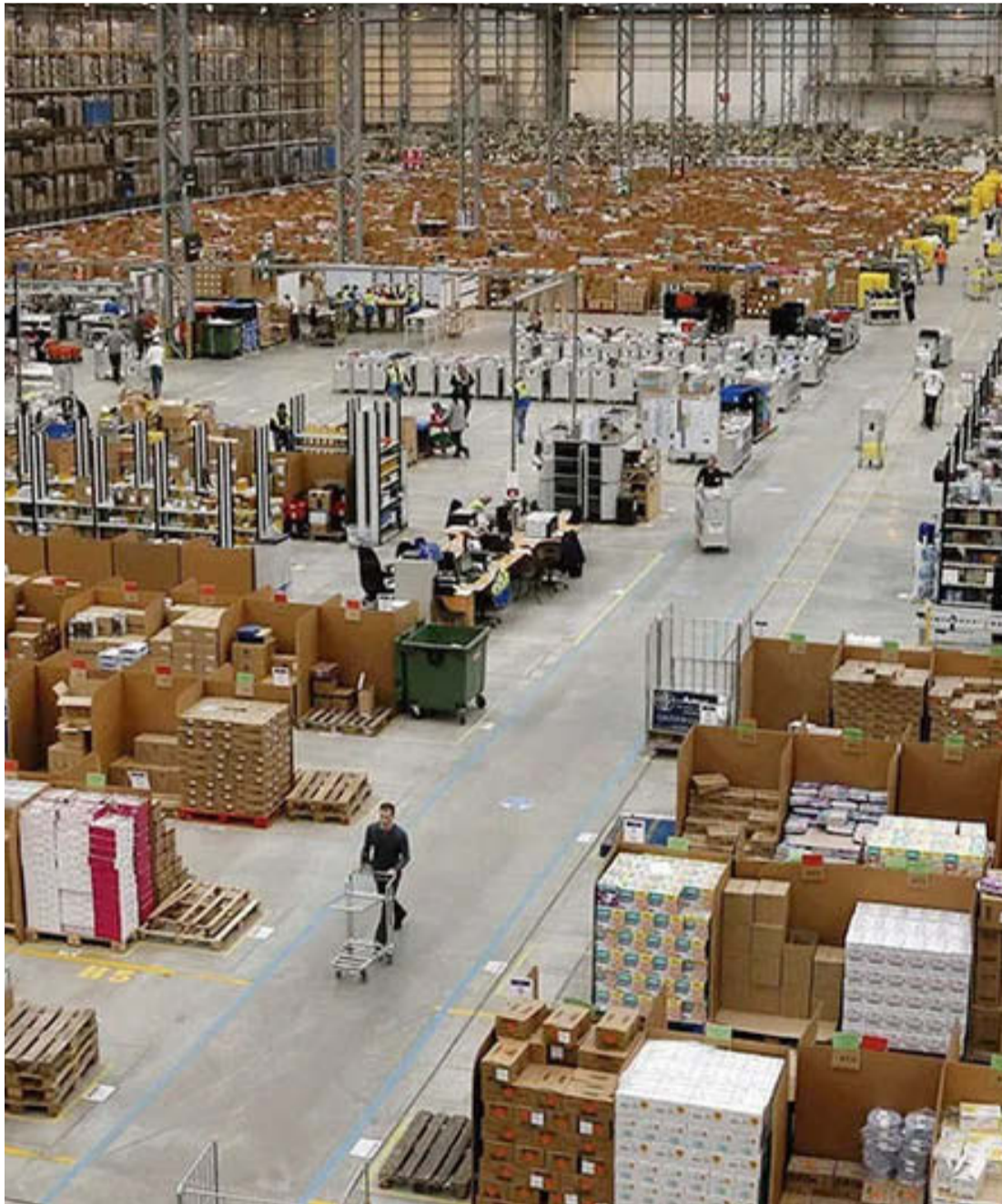
México es de los pocos países en los que el comercio digital tiene amplia competencia.

Otra recomendación fundamental es priorizar las compras en comercios formales que cuenten con respaldo legal, tiendas físicas y plataformas digitales oficiales. Esto permite al consumidor acceder a garantías, políticas de devolución y mecanismos de atención en caso de que el pro-