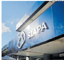
ESTE AÑO. El Siapa registró un 'hackeo' que afectó su sistema de pagos.