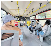
CAMIÓN. Actualmente el usuario paga una tarifa de 9.50 pesos, la cual ya tiene un subsidio de 1.16 pesos.