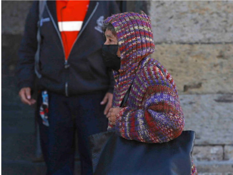
La reducción de horas de luz tiene un efecto directo en el enfriamiento nocturno. F.CARRANZA