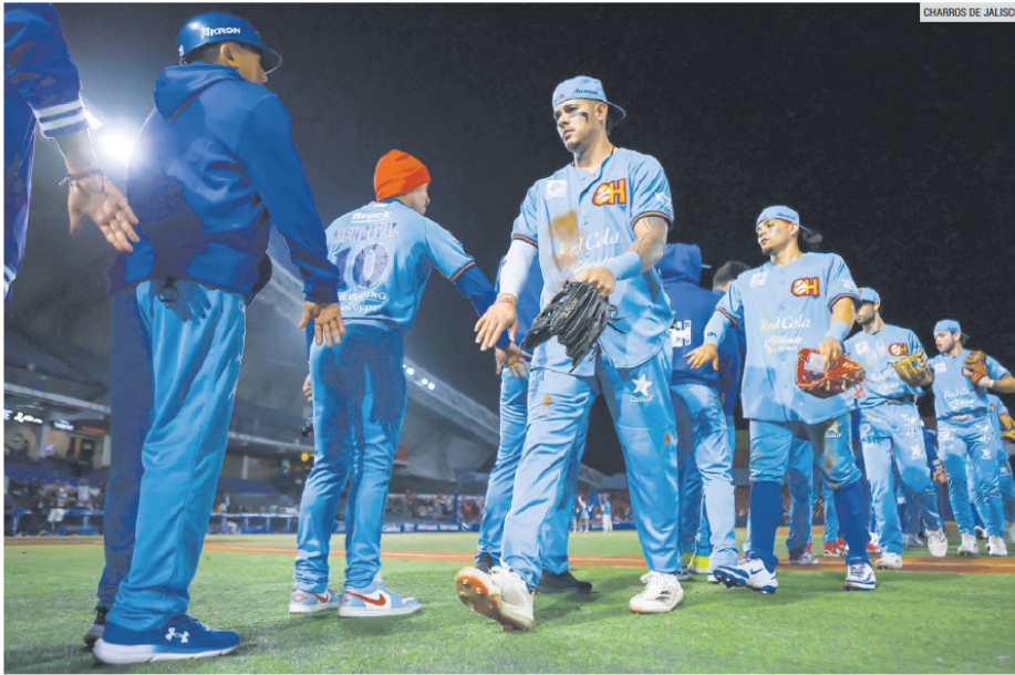
SE PERFILAN RUMBO A LOS PLAYOFFS. La actividad de los Charros de Jalisco aporta un ingrediente especial a estas fechas, al mantener vivo el interés por el beisbol invernal.

Algunas Ligas celebran estas fechas con jornadas emblemáticas