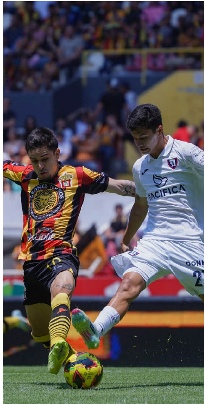
UdeG y Tepatitlán fueron protagonistas.

Mientras la liga vive procesos de cambios de franquicias e incertidumbre sobre el futuro del ascenso y descenso, que tendría que regresar en junio de 2027, es un hecho que los tres representantes de Jalisco en la categoría, buscarán en 2026 continuar con su rol protagónico. ■