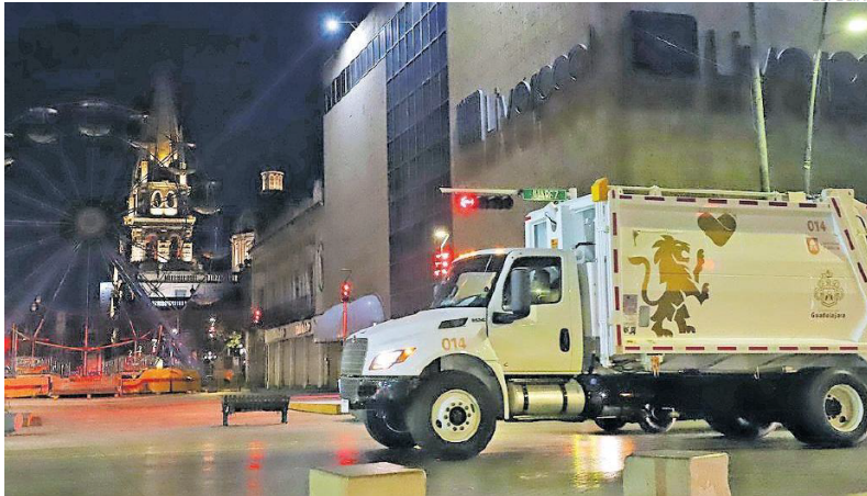
FUERA NO. Desde el Municipio se llamó a evitar sacar basura a la vía pública durante los días de suspensión del servicio.