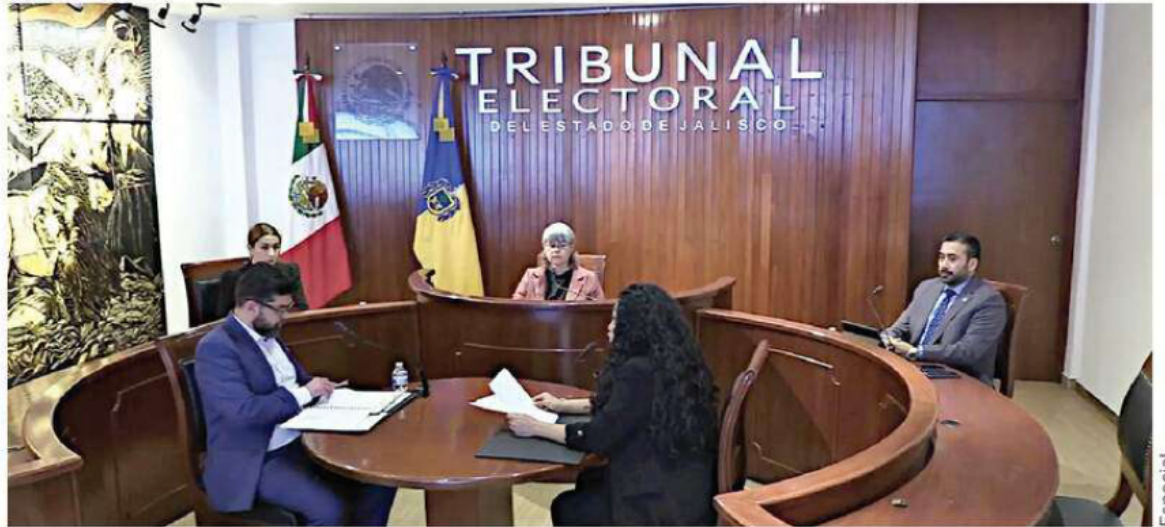
■ El Tribunal Electoral del Estado de Jalisco sesionó el pasado miércoles.