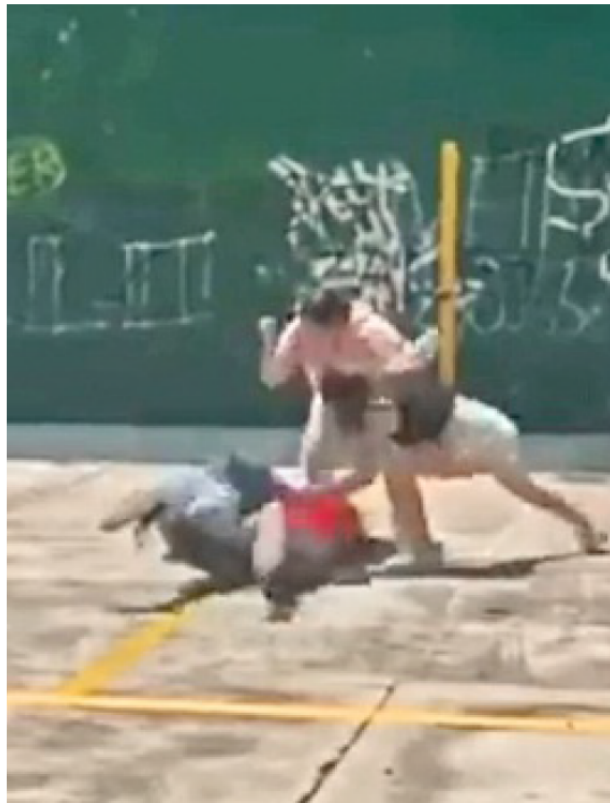
El 13 de septiembre, tres jóvenes golpearon a una estudiante de la preparatoria regional de Ocotlán de la UdeG.

La diputada morenista presentó ante el Congreso de Jalisco una iniciativa que, de ser respaldada por el Pleno, permitiría requerir a la Secretaría de Educación y