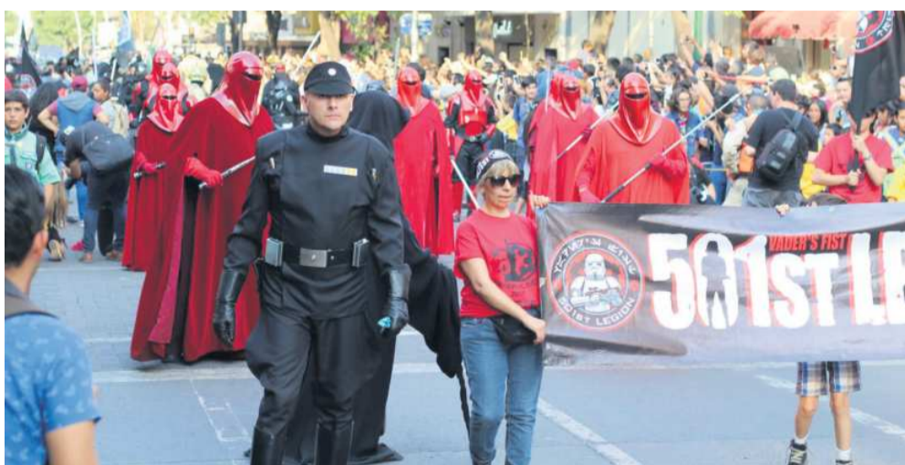
PERSONAJES. Desfilarán miembros de la Legión 501 y la Legión Rebelde.

te le ilusiona mucho vernos, y a nosotros también nos gusta ver a las familias conviviendo y compartiendo un gusto como 'Star Wars' que ya lleva cuatro generaciones de personas viviendo las sagas".