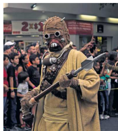
REQUISITO. Los trajes que usan los participantes deber ser de alta calidad en su confección.