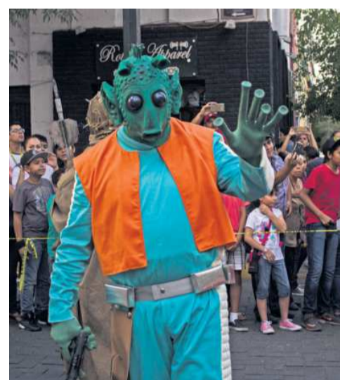
CABEZAS. Este evento es organizado por el club de fans internacional de "Star Wars".