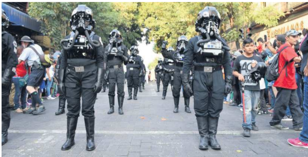
CITA. El sábado 7 de octubre, a las 16:30 horas.