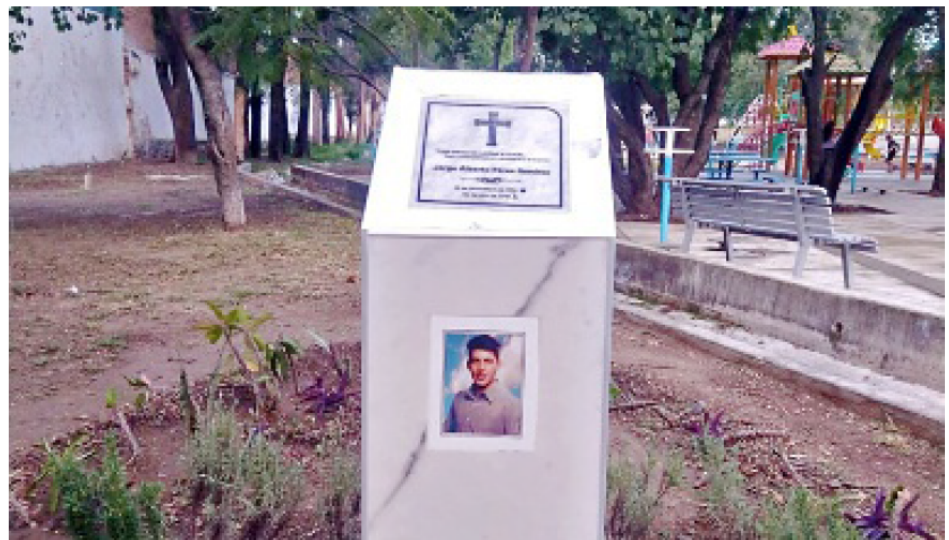
En honor del estudiante colocaron un memorial cerca de donde fue asesinado.

“Él ya estaba trabajando, de hecho, en una empresa, donde dio su servicio, ahí mismo, en esa empresa lo contrataron, él ya tenía ocho