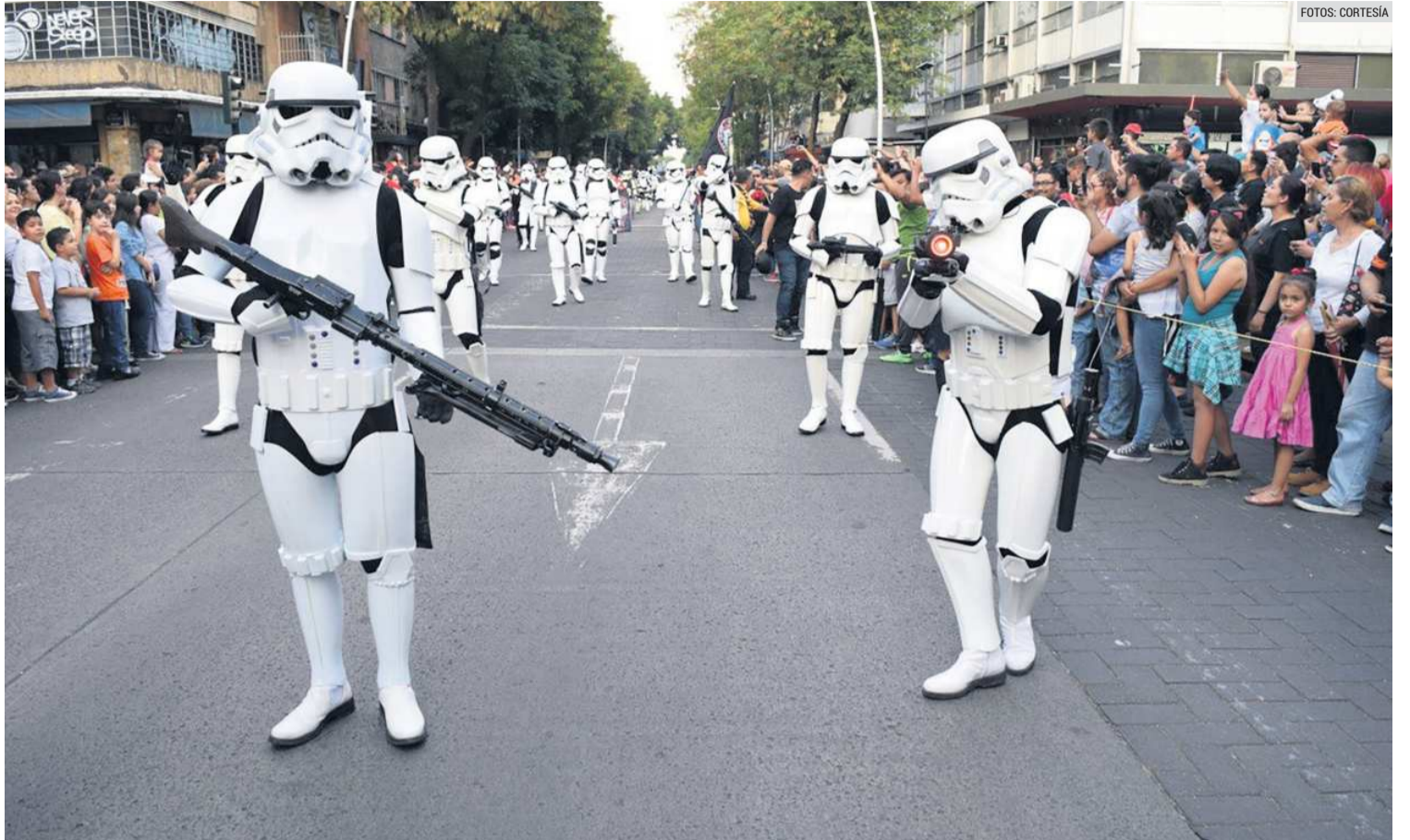
"DESFILE DE LAS GALAXIAS". El evento que se realizará por las calles de Guadalajara es de corte familiar.