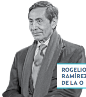
ROGELIO RAMÍREZ DE LA O

► Gran convocatoria tuvo el titular de Hacienda, Rogelio Ramírez de la O , en la Conferencia anual de Santander. Asistieron representantes de fondos de inversión, corporaciones y personajes del ámbito financiero. Ahí resaltó que el desempeño económico de México ha sido mejor de lo esperado, debido al impulso de las exportaciones, la recuperación del sector servicios y el manejo de la deuda. Además, pronosticó un crecimiento superior al previsto.