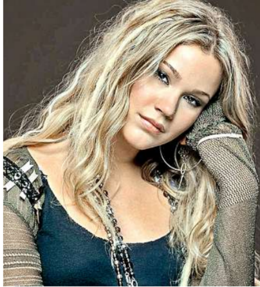
■ Joss Stone dará un concierto en la Ciudad el 30 de abril como parte del Festival IN-EDIT.