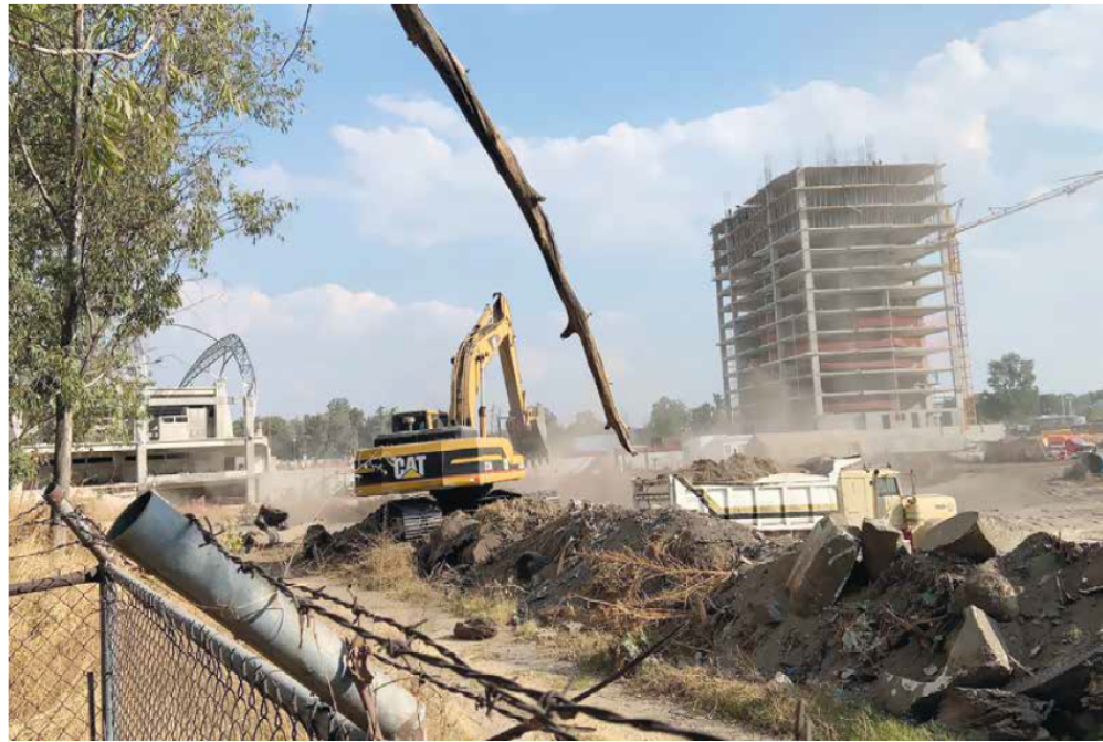
EN OBRAS. En el predio de la Calzada y Periférico se construye ya una torre departamental y un polideportivo.

En rueda de prensa desde la Ciudad de México, vecinos de Huentitán in-