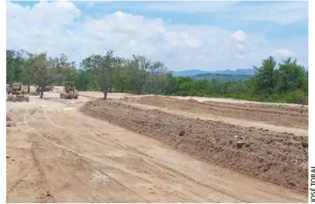
PROYECTO CLAVE. La avenida troncal conectará a El Disparate con la ciudad; por ahora tiene 60 por ciento de avance.

“(Lemus dijo) que el terreno se puede recuperar y en su momento hacer un parque. Si hubiera ese planeamiento de parte del Municipio, el gobierno del estado estaría en toda la disposición para ver si hacemos algún proyecto de esa naturaleza ahí.