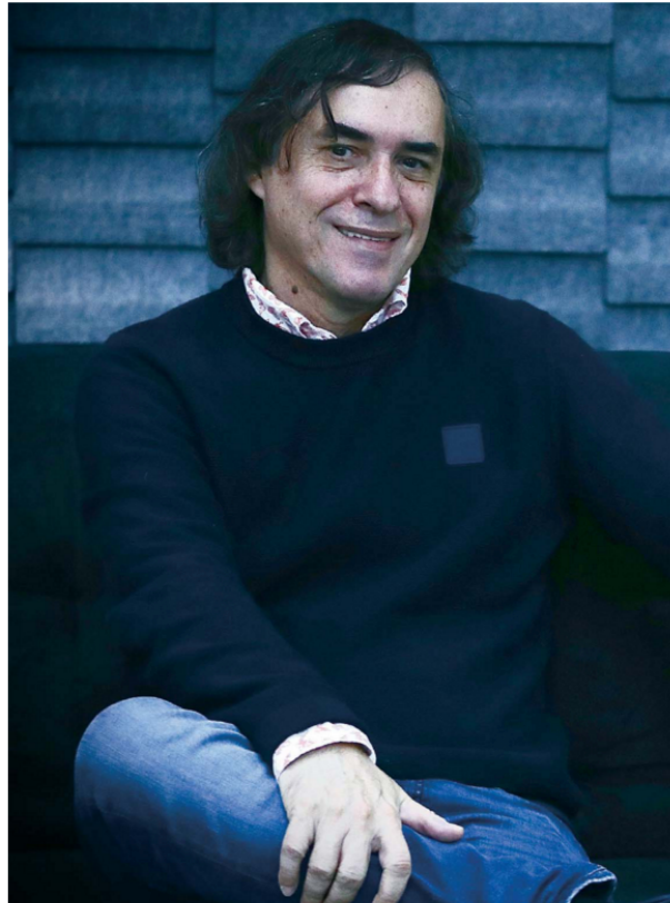
REMIEN: FRESOS/EL UNIVERSAL

Dejé de escribir poesía porque tenía la sensación de que ya era suficiente, y que si seguía escri-