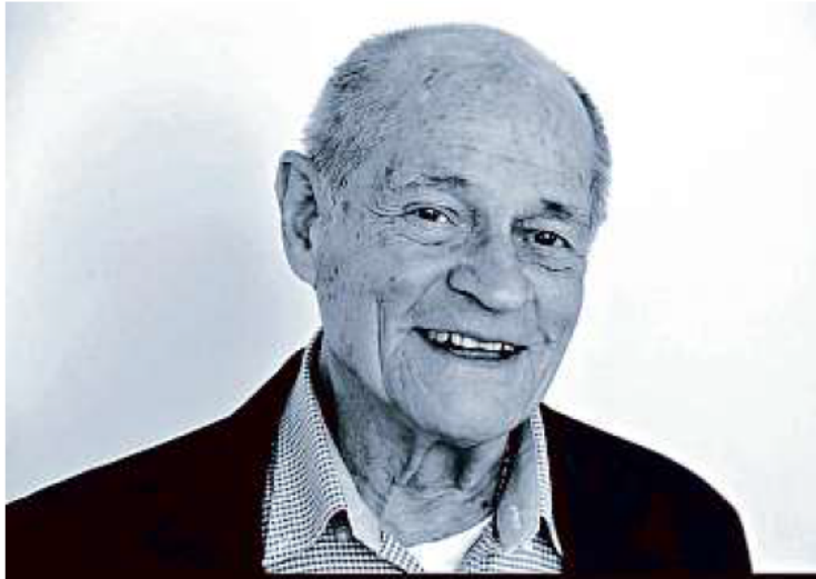
■ Fray Gabriel Chávez de la Mora, destacado proyectista de arquitectura sacra, falleció el sábado a los 93 años en Morelos.

Nacido en 1929 en Guadalajara, Chávez de la Mora fue parte de la primera generación de estudiantes de la Escuela de Arquitectura de la Universidad de Guadalajara (UdeG), casa de estudios que apenas el 9 de noviembre pasado le rindiera homenaje con un doctorado