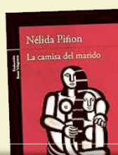
La camisa del marido