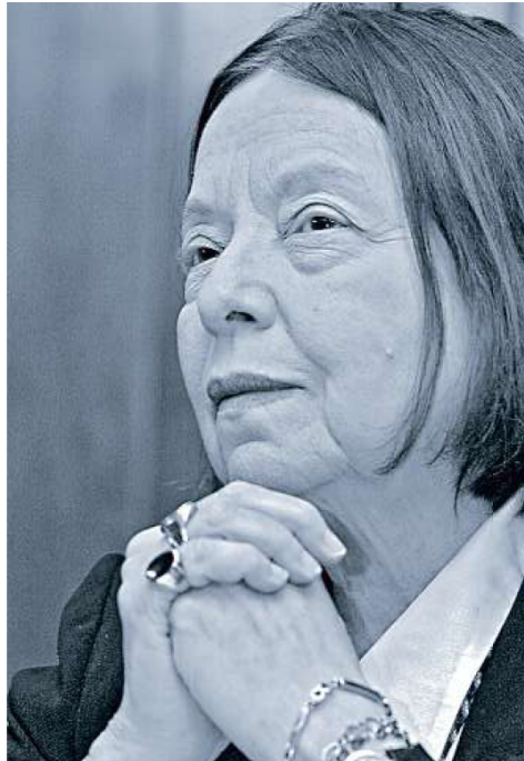
La autora brasileña falleció el sábado en Lisboa a los 85 años.

Como una de las voces literarias más prominentes de su país en toda Iberoamérica,