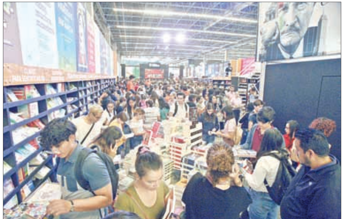
▲ El fallecimiento de notables escritores que daban un tinte más liberal a la cita librera, como Gabriel García Márquez, Carlos Fuentes (en la imagen), José

“Todos los días se levantaba muy temprano, él era pájaro madrugador y yo ave nocturna. Salía a la calle a encontrarse con la vida, por eso escribía en los cafés y si tenía vista a la calle, mejor.”