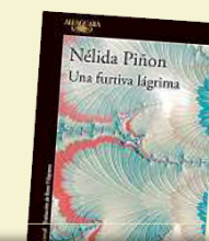
Una furtiva lágrima