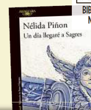
Un día llegaré a Sagres