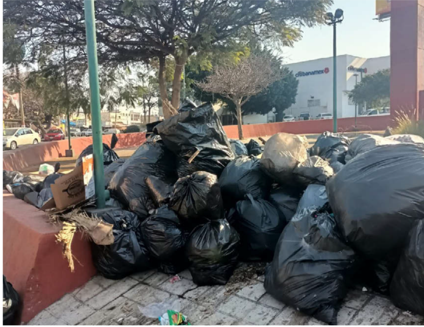
Tonalá vive una crisis en la recolección de basura. ESPECIAL