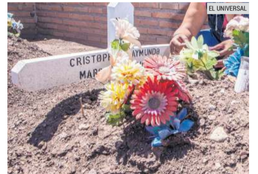
MENORES. Centenas han sido asesinados en territorio nacional desde 2015.

Esto correspondía a un incremento de 5.6% con respecto a la cifra registrada en el mismo periodo de 2021 (427).