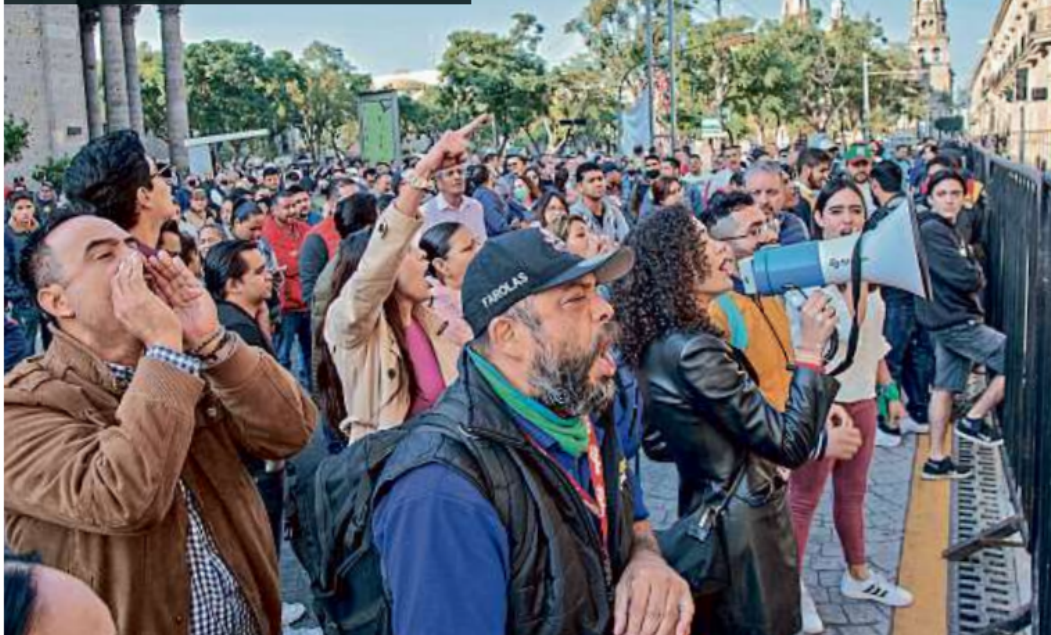
Anael I Iamas

■ Afuera del edificio del Supremo Tribunal protestaron por el despido de personal del Consejo de la Judicatura.