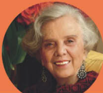
Elena Poniatowska México