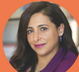
Bodour Al Qasimi Sharjah