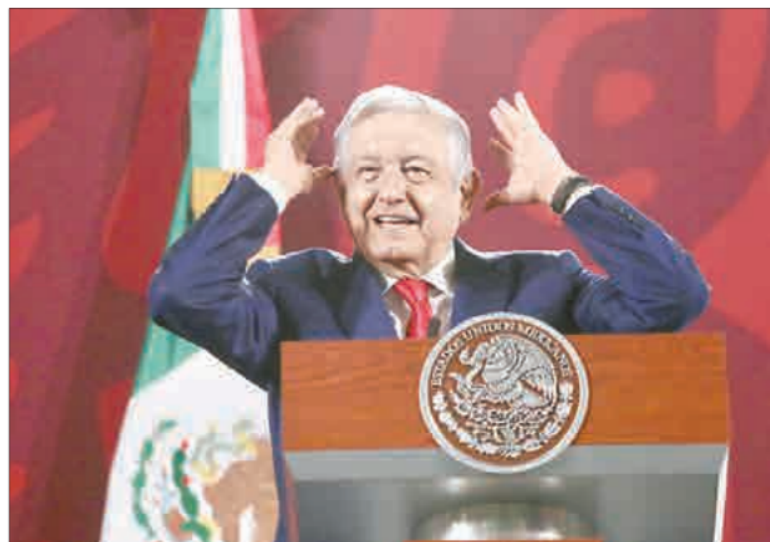
▲ En su mañanera de ayer, el presidente López Obrador estimó en 50 o 60 mil personas

NO HAY MUCHO margen, por desgracia, para la ilusión cívica o política: la realidad cupular, la prevalencia de los intereses de grupo, han entrado ya a la fase impía de la inminencia electoral, por más que 2024 a alguien pudiera parecerle distante. ¡Hasta mañana!