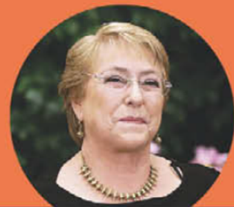
Michelle Bachelet Chile