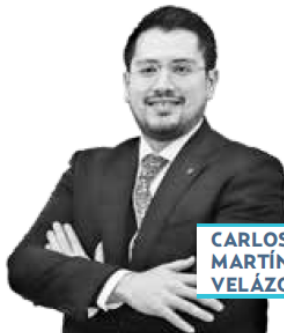
CARLOS MARTÍNEZ VELÁZQUEZ

› Esfuerzo titánico hizo el Instituto del Fondo Nacional de la Vivienda para los Trabajadores (Infonavit), que dirige Carlos Martínez Velázquez , pues a partir este martes, comenzará a otorgar créditos hipotecarios hasta por 2.4 millones de pesos, con lo que los trabajadores podrán acceder a viviendas de mayor valor y de mejor ubicación, no necesariamente en lu-