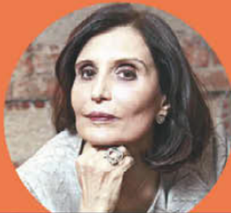
Ángeles Mastretta México