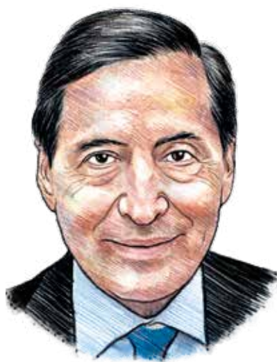
Rogelio Ramírez de la O

S I EN ALGO se parecen el presidente Andrés Manuel López Obrador y el secretario de Hacienda, Rogelio Ramírez de la O , es que ambos se obsesionan con las teorías de conspiración.