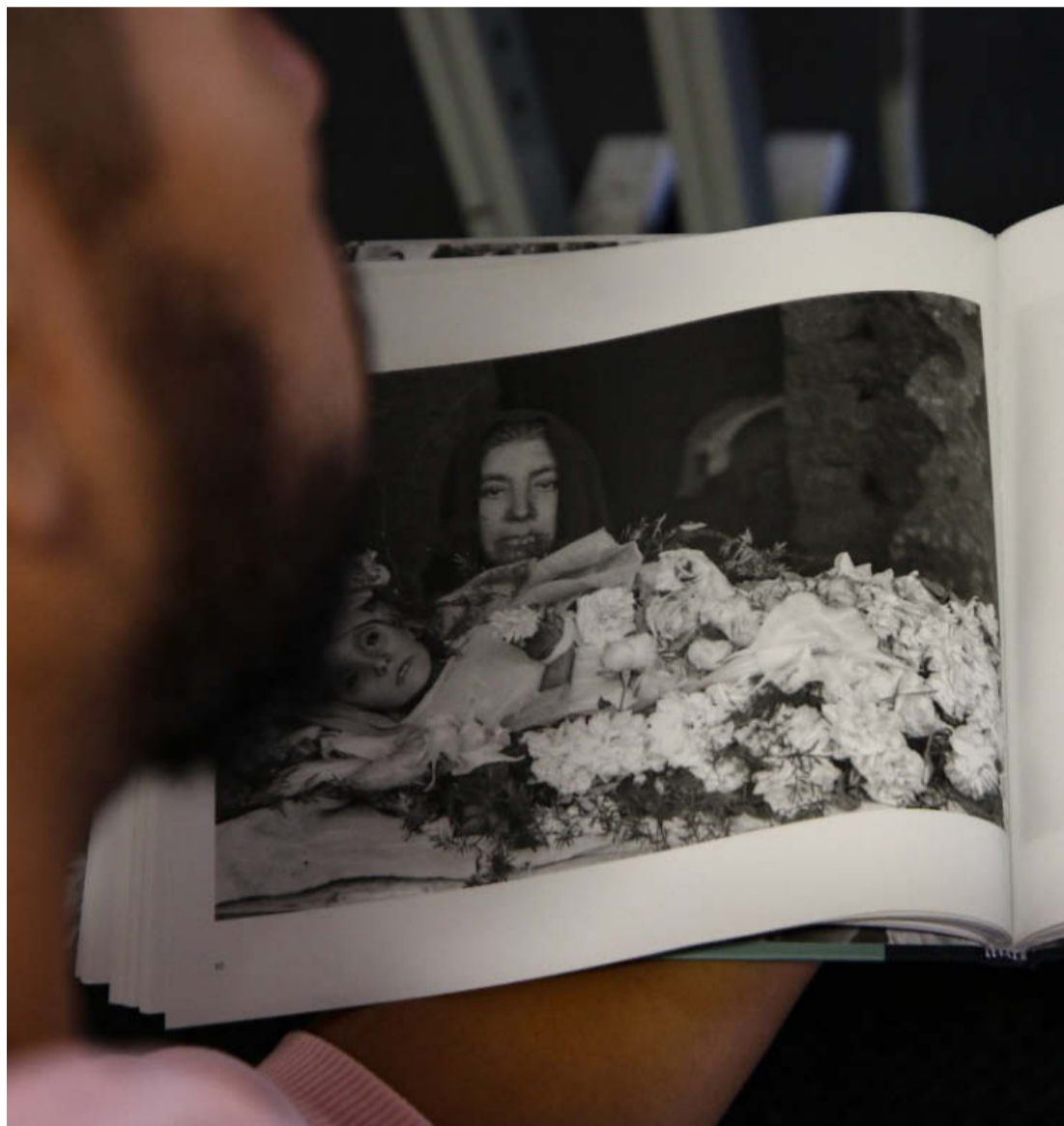
Las imágenes publicadas datan de la década de 1930. ESPECIAL

“Cuando el niño moría se le hablaba al padrino, que solían ser los tíos o cuñados. Ellos eran los encargados de vestir y coronar al angelito. Debían vestirlo de blanco, prepararlo para que entre al reino de los cielos y ponerle una corona de flores, cuyo simbolismo es la gloria que alcanzan por la gracias de haber muerto sin pecado (...) En las fotografías recopiladas se nota que la mayoría de los pequeños fallecidos estaban vestidos con su ropón de bautizo, con coronas de flores