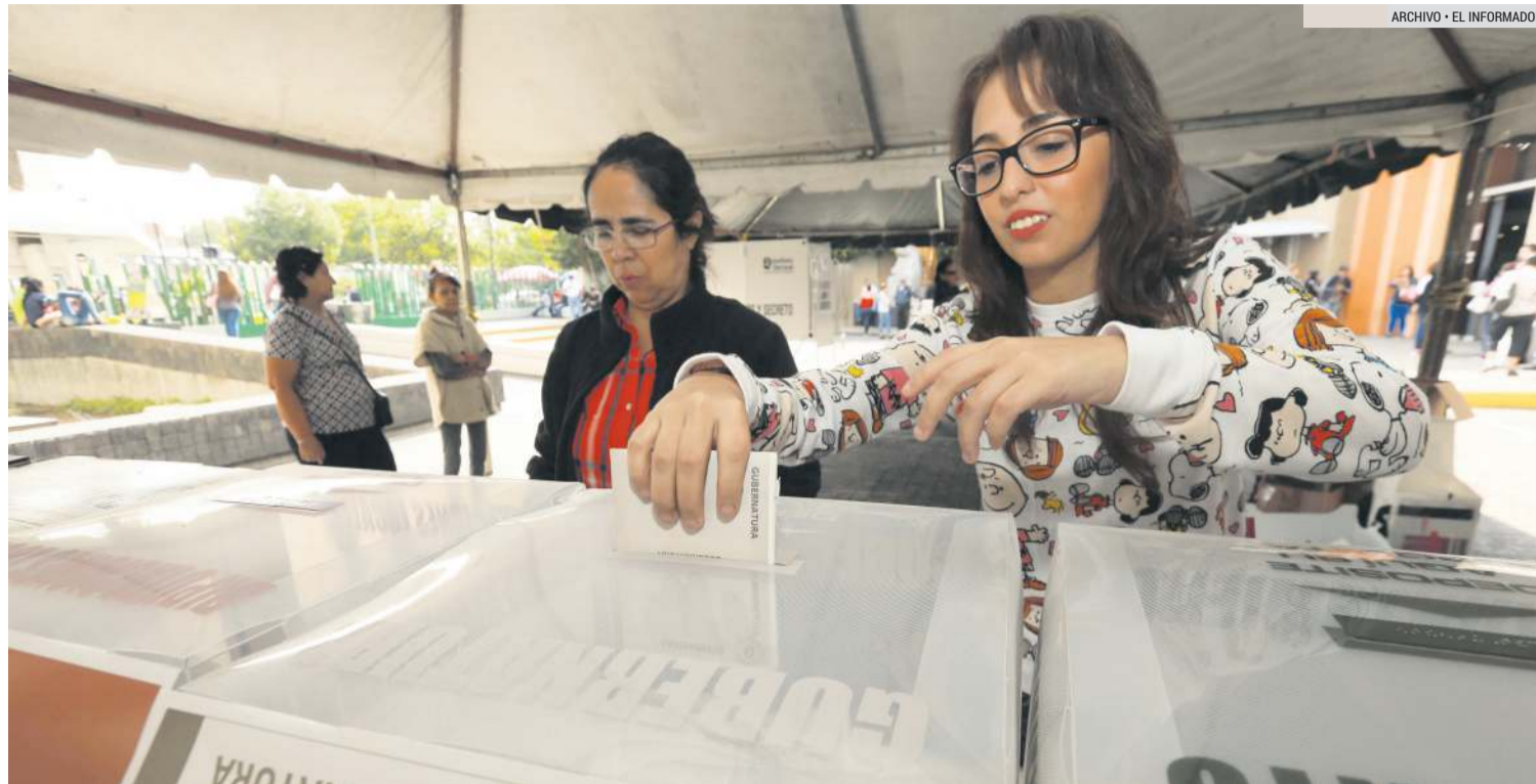
COMICIOS. Las elecciones deben garantizar un ejercicio democrático que dé legalidad a las instituciones.

Señalan que los cambios en los comicios vienen desde el poder en vez de la sociedad