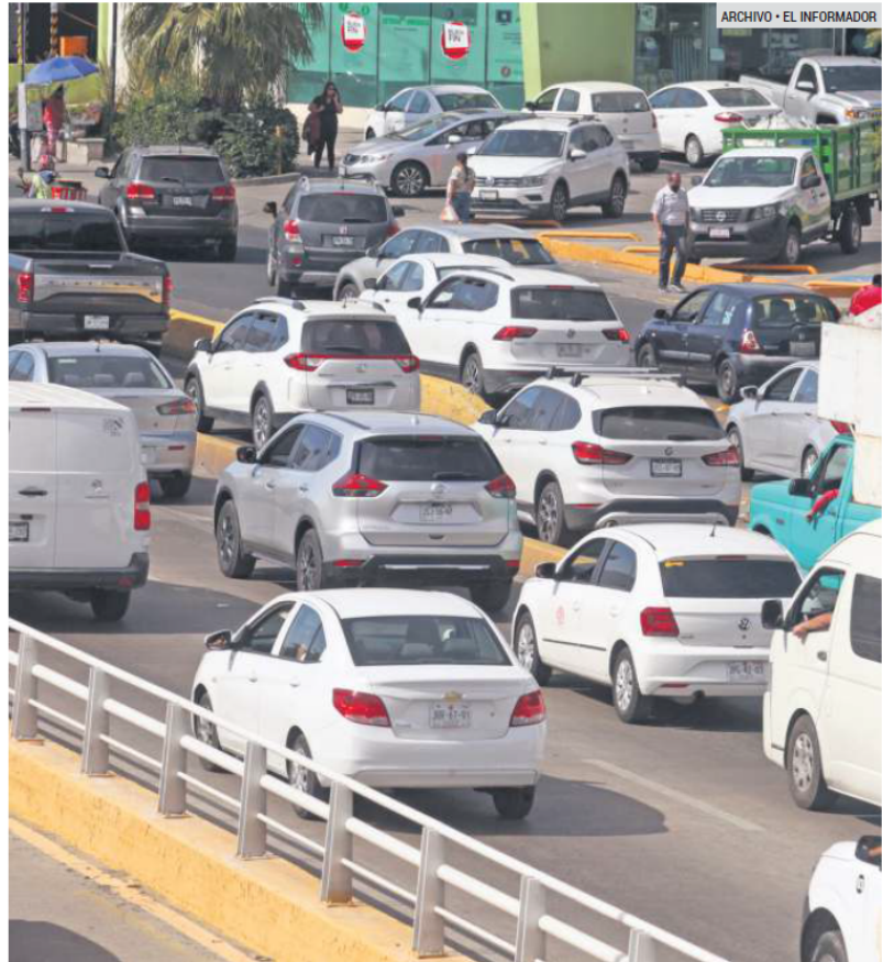
CONTAMINAN. El aumento de parque vehicular de autos usados propicia mayor emisión de partículas contaminantes en el aire.

En los últimos siete años aumentó en casi 50% el número de atenciones relacionadas con enfermedades respiratorias como EPOC y asma atribuidas a