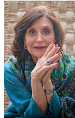
Irene Vallejo, Sergio Ramírez y Ángeles Mastretta, entre los escritores invitados a la FIL.