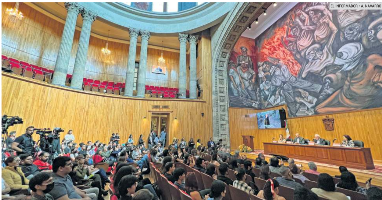
PRESENTACIÓN DEL PROGRAMA. El evento se realizó en el Paraninfo Enrique Díaz de León de la Universidad de Guadalajara.