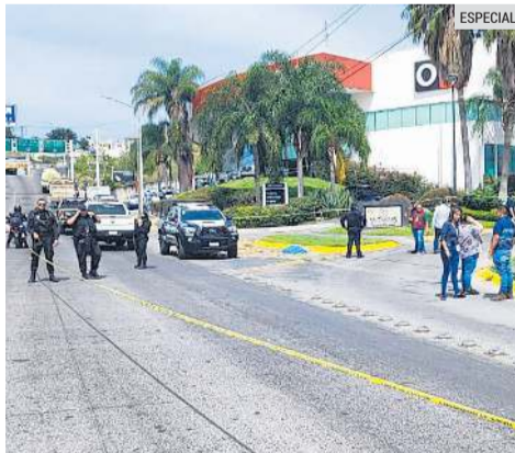
ESCENA DEL CRIMEN. El asesinato ocurrió en la zona de Acueducto.