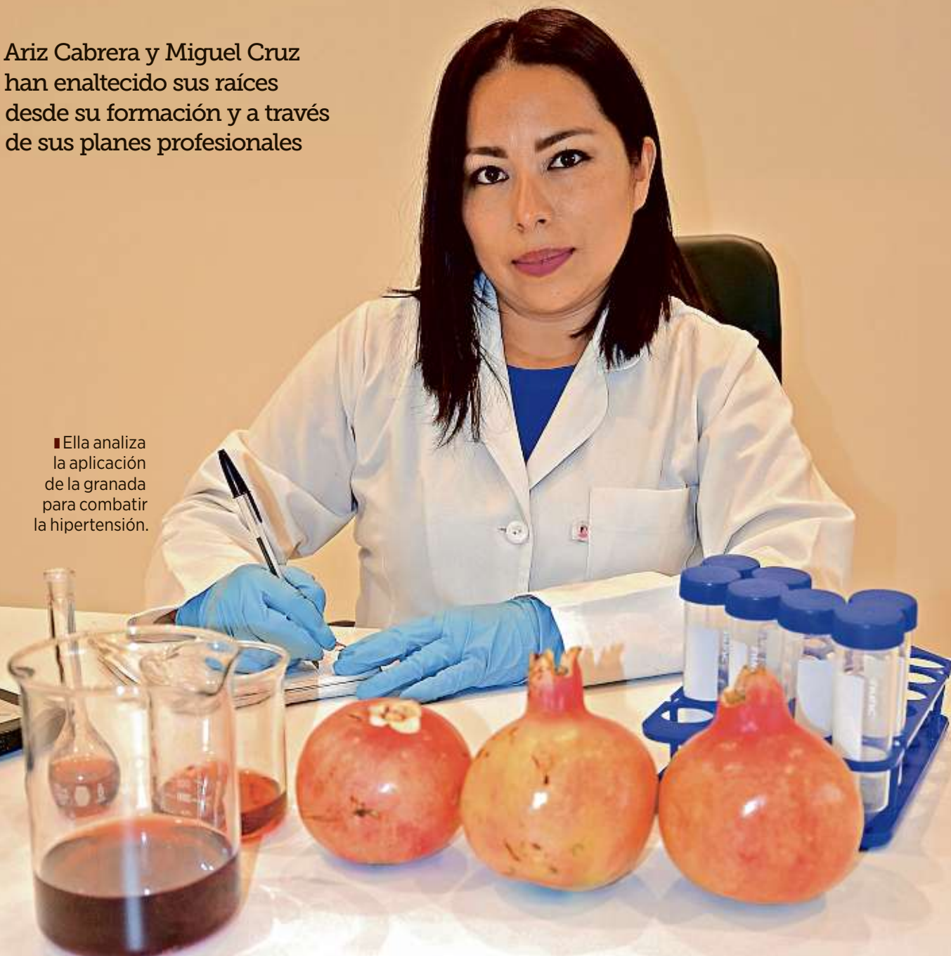
■ Ella analiza la aplicación de la granada para combatir la hipertensión.