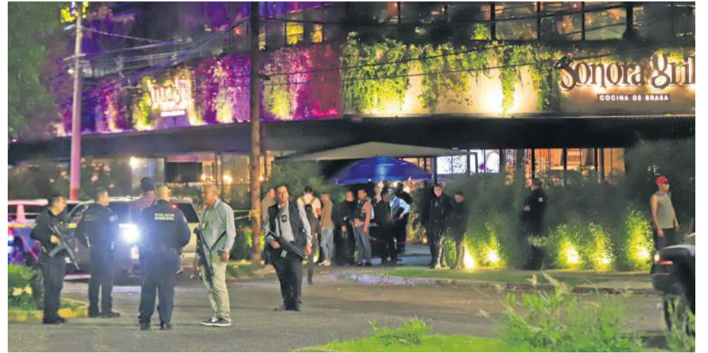
MIEDO. La agresión se llevó a cabo dentro de un restaurante en Providencia.