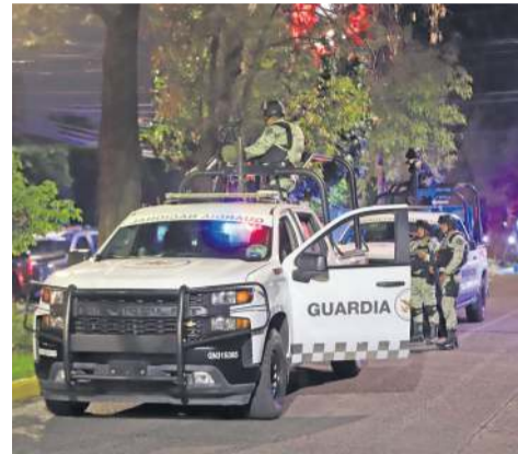
AYUDA. Decenas de oficiales resguardaron la escena.