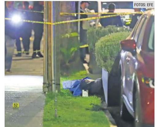
MUERTOS. En el lugar fallecieron tres personas.