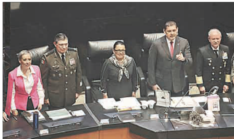
▲ La secretaria de Seguridad y Protección Ciudadana, Rosa Icela Rodríguez, encabezó la comparecencia en el Senado acompañada

ADEMÁS, SE HA aplicado a confrontar a gobernadores (Alfaro, de Jalisco, y Samuel García, de Nuevo León) correspondientes a Movimiento Ciudadano, partido que no votó en el Congreso federal a favor de la militarización guardiana antes mencionada. ¡Hasta mañana!