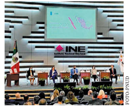
- Diagnóstico. El informe fue elaborado por el INE, el Inegi y el PNUD.

• La población muestra una gran desconfianza hacia las instituciones, particularmente con aquellas que, de acuerdo con la Constitución y las leyes, deben representarla: los partidos políticos y los órganos legislativos en los dos órdenes