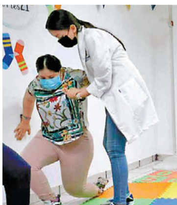
-Estudio. Buscan identificar, entender y atender las principales comorbilidades de esta población.