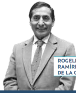
ROGELIO RAMÍREZ DE LA O

► Si bien se prevé un intenso debate en la Cámara de Diputados, es prácticamente un hecho que hoy se aprueba la Ley de Ingresos de la Federación 2023. El proyecto de la Secretaría de Hacienda, a cargo de Rogelio Ramírez de la O , contempla una recaudación de ocho billones 299 mil 647.8 millones de pesos. Legisladores de oposición adelantaron que votarán en contra, pero Morena y sus aliados del PVEM y PT cuentan con los votos suficientes para que pase sin problemas.