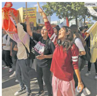
EXIGEN. Estudiantes marchan por la autonomía universitaria.

“Lo que necesitamos es empezar a invertir ahora y durante los siguientes diez años para regular la matrícula. No lo podemos atrasar, es posible, necesitamos recibir los primeros grupos en Tlaquepaque en lo que empezamos a construir, recibir los primeros grupos en Chapala. Así empezó CU-Tonalá en la Casa de la Cultura, y hoy tiene uno de los campus más modernos del país”, aseveró.