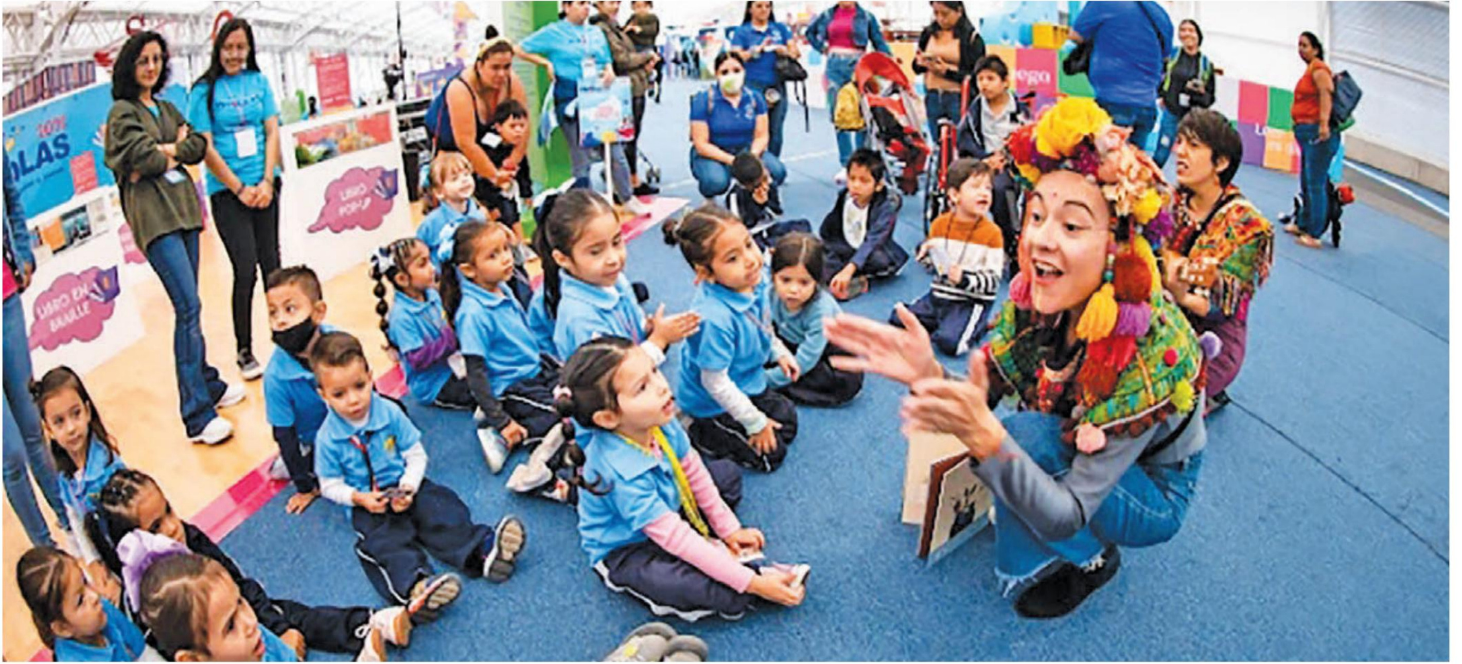
El Festival Creativo para niñas, niños y jóvenes "Papirolas" se lleva a cabo del 5 al 9 de octubre.