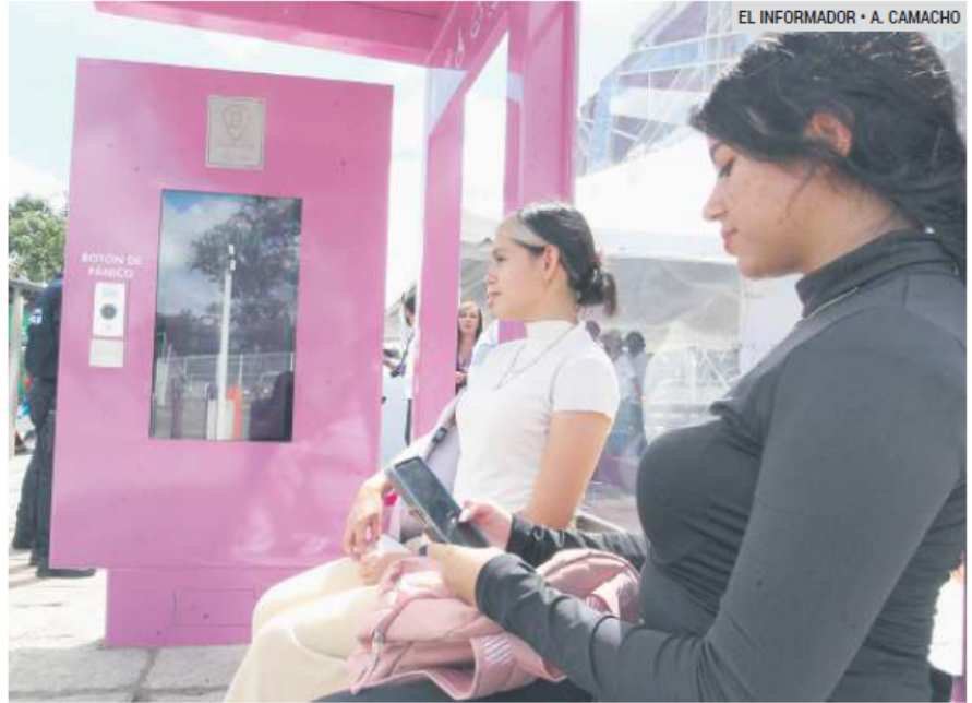
SEGURIDAD. El primer punto de vigilancia está afuera de la Biblioteca Pública del Estado “Juan José Arreola”; hay otros dos en proceso.

La zona se encuentra sobre la lateral del Periférico Norte en la explanada de la Biblioteca Pública del Estado “Juan José Arreola”, punto donde confluyen estudiantes de centros universitarios y prepa cercanas, así como visitantes al recinto y al Centro Cultural. Los otros dos puntos se ubicarán en la zona Centro de Zapopan y en el Centro Cultural Constitución.