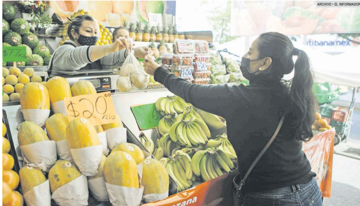
CANASTA BÁSICA. A pesar de los constantes incrementos en los precios de los productos básicos se mantuvo el consumo.

Los mexicanos siguen con buen ritmo de compras a pesar del alza en los precios