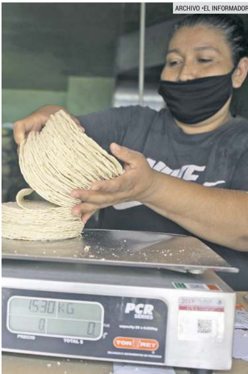
CONSUMO. Las tortillas son un producto básico en la cocina de los mexicanos.

Aunque la Secretaría de Economía establece un precio promedio para el kilo de tortilla en la Zona Metropolitana de Guadalajara (ZMG) de 22.70 pesos, en la realidad el costo es mayor.