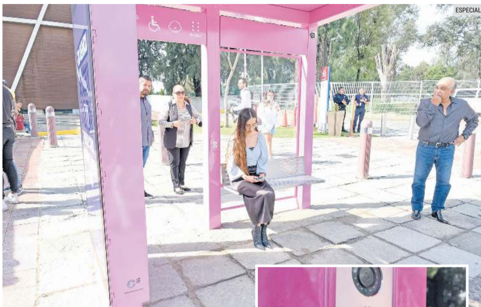
FUNCIONAMIENTO. Personal del C5 municipal escuchará la emergencia y enviará el apoyo.

Estos puntos serán operados de manera transversal por la Comisaría de Zapopan a través de la Unidad de Atención a Víctimas de Violencia Intrafamiliar y Género (UAVI) en conjunto con el InMujeres y con la Coordinación de Construcción de Comunidad.