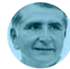
ADÁN AUGUSTO LÓPEZ

► Buena aceptación tuvo el discurso emitido ayer por el presidente de la Corte, Arturo Zaldívar , en la inauguración de un encuentro sobre crimen organizado, promovido por el Pacto Europa-Latinoamérica. Ahí dejó claro que ese flagelo sólo puede combatirse con cooperación internacional. El embajador de la Unión Europea en México, Gautier Mignot , respaldó al ministro.