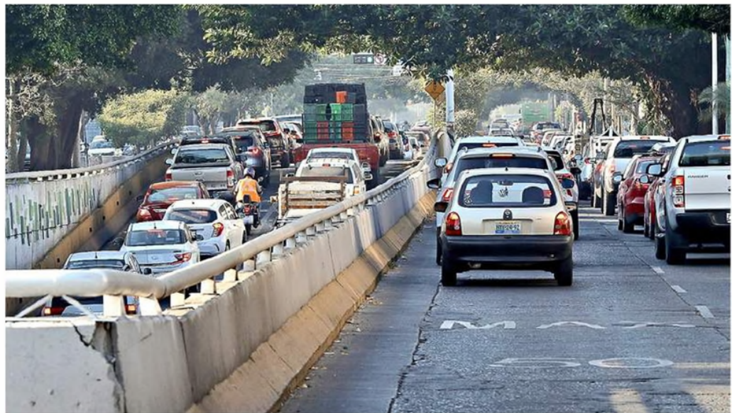
Los congestionamientos viales en la Avenida López Mateos son comunes.

También planteó obligar al uso de transporte escolar en planteles privados, iniciativa que está en la “congelación”.