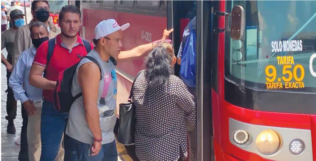
50 CENTAVOS DE 'AYUDA'. El gobernador presumió que el subsidio millonario frenará el alza a la tarifa del transporte público de 9.50 a 10 pesos.