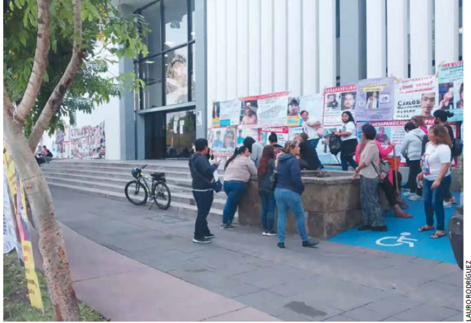
SE DEBE DESLIGAR. En el colectivo consideran que no habrá justicia mientras la FEPD pertenezca a la Fiscalía del Estado.