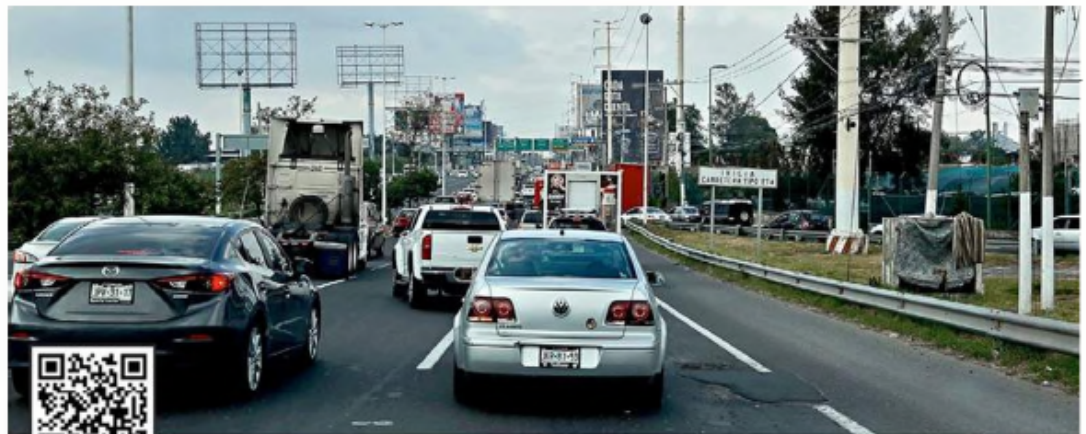
■ Cuando hay algún evento en el Estadio Akron, el congestionamiento vial se presenta tanto en Av. Vallarta como en Aviación, por ello la propuesta de un nodo.

“Se le hace muy fácil a la autoridad proponer infraes-