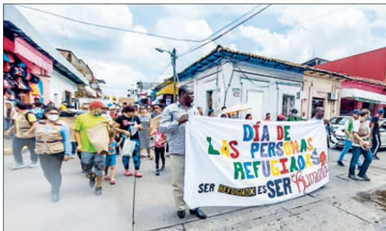
▲ Unos cien migrantes, acompañados por organizaciones defensoras de derechos,