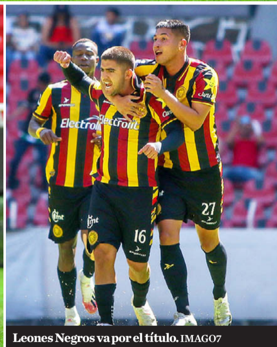
Leones Negros va por el título.