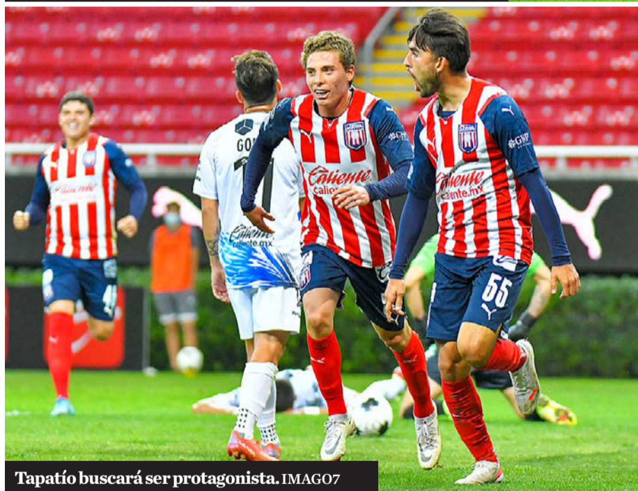
Tapatío buscará ser protagonista.