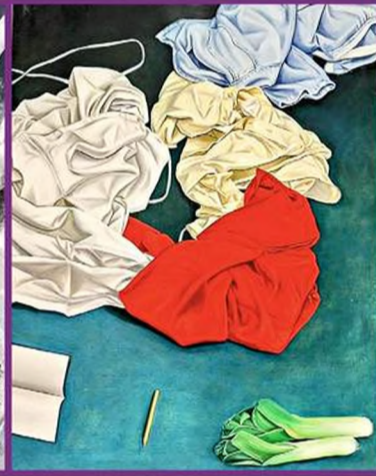
■ "Altar", que formó parte de la exposición "La Ronda Nocturna: Euforia Artística en la Guadalajara de los 90", que se montó en el Museo de las Artes en 2015.