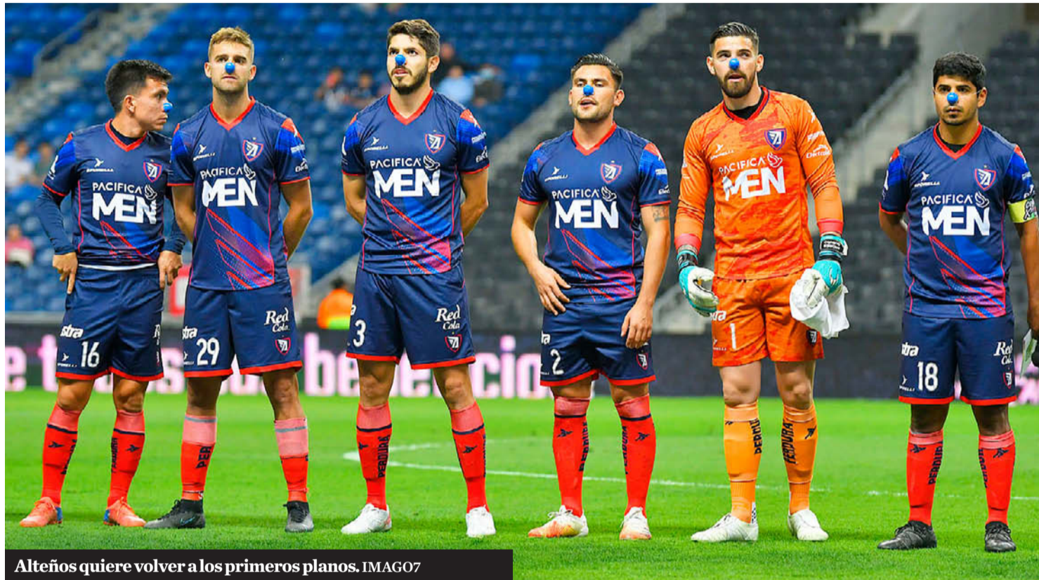
Alteños quiere volver a los primeros planos.

Expansión Mx. Tepatitlán, Leones Negros y Tapatío tienen sus planteles cerrados para el arranque de la Temporada 2022-2023 este fin de semana