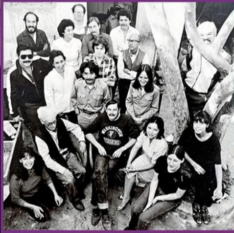
■ Integrantes de Taller de Gráfica en 1983.