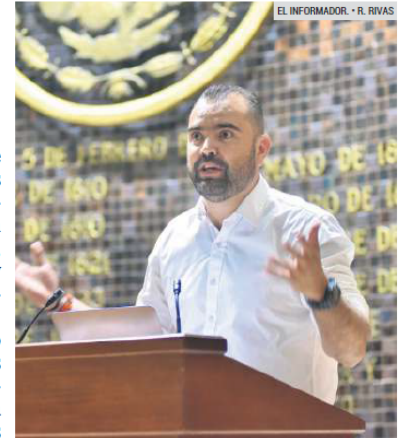
DECISIÓN. El legislador considera que el esquema de financiamiento fue la mejor opción.

El diputado añadió que luego de la publicación de los decretos en el Periódico Oficial, lo que sigue es lanzar la licitación pública nacional para recibir propuestas de empresas que aspiren a realizar la obra.