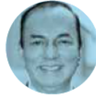
JOSÉ MANUEL DEL RÍO VIRGEN

› Luego del festejo en Palacio Nacional por la victoria electoral del colombiano Gustavo Petro , se acrecenta el plan del mandatario mexicano Andrés Manuel López Obrador para consolidar la integración de las naciones latinoamericanas, y nos hacen ver que si también se logra el triunfo de Luiz Inácio Lula Da Silva , en Brasil, en la elección programada para octubre, todo estará listo para esa nueva realidad geopolítica en el continente americano.