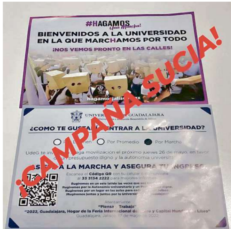
Volantes distribuidos en que se asegura que al acudir a la marcha se garantiza el ingreso a la UdeG.

“¿Cómo te gustaría entrar a la universidad? Asiste a la marcha y asegura tu ingreso. Rugiremos en un solo latido las veces que sea necesario”, se leía en los volantes que además contenían el número telefónico de la Universidad.