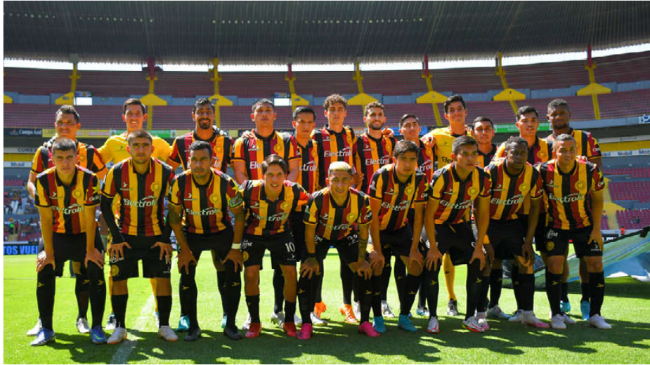
UdeG tendrá que esperar al menos dos temporadas para pensar en ascender. IMAG07

En total eran seis apartados que se debían cumplir: Expediente de afiliación, Infraestructura, Control Económico, Estructura Institucional, Uso de recursos del Fondo de Mejoras e Informe del plan de negocios por parte del consultor externo. Solo UdeG completó