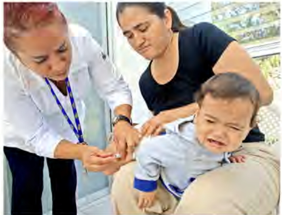
■ Ante los casos de hepatitis aguda infantil que están apareciendo en el mundo, se recomienda que los menores de edad estén vacunados contra la hepatitis A y B.

"Pero una preocupación mayores que alrededor del 10 por ciento de todos los casos se están presentando con una gravedad extrema, lo que conocemos como hepati-