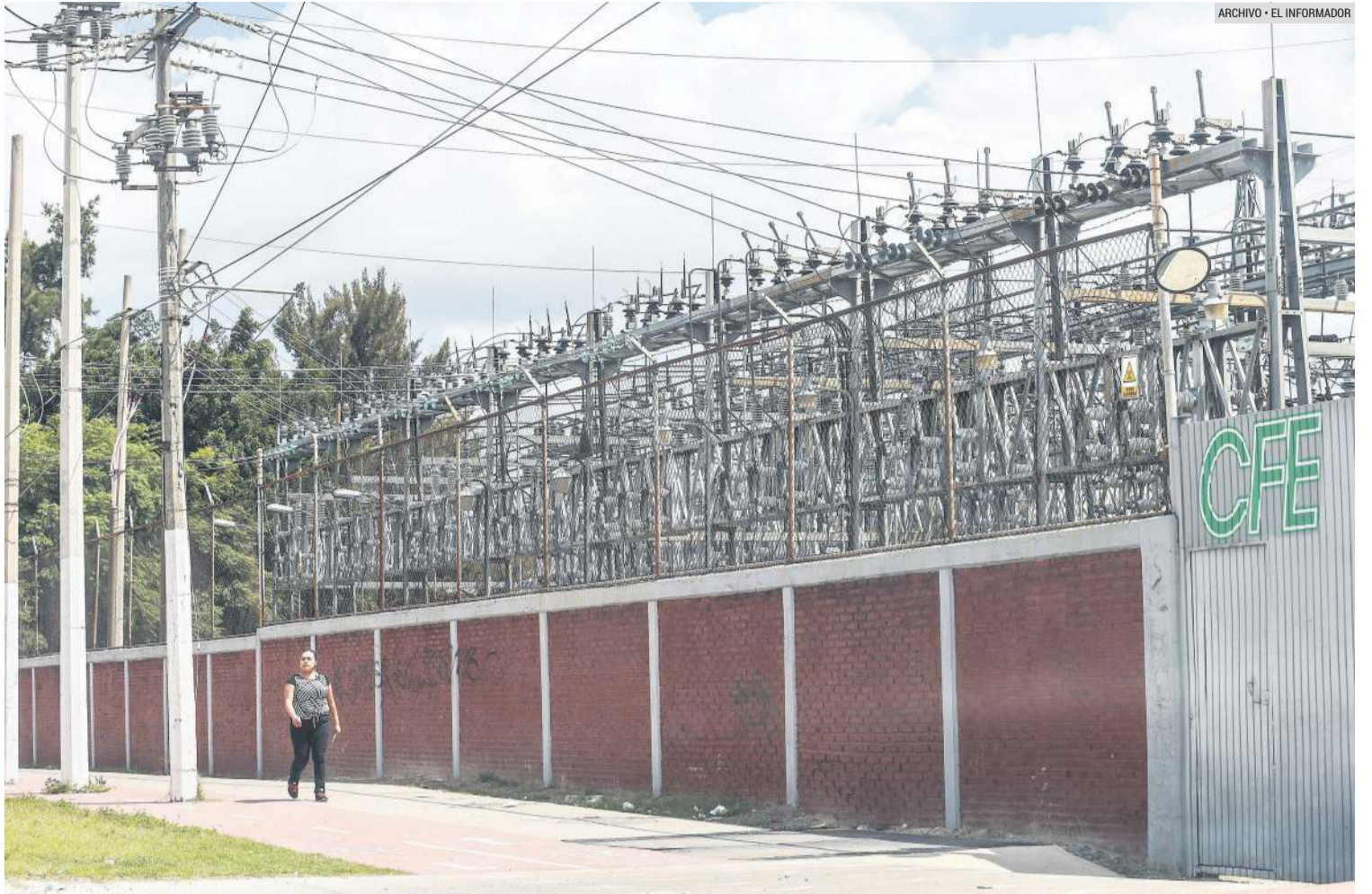
SEÑALAMIENTO. Especialistas remarcan que en plantas de la Comisión Federal de Electricidad se usan combustibles más caros y contaminantes.