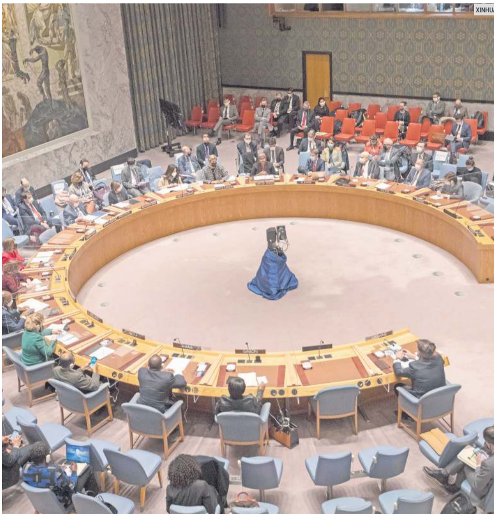
TEMEN LO PEOR. El Consejo de Seguridad en la sede de la ONU evalúa opciones pacíficas para el conflicto.