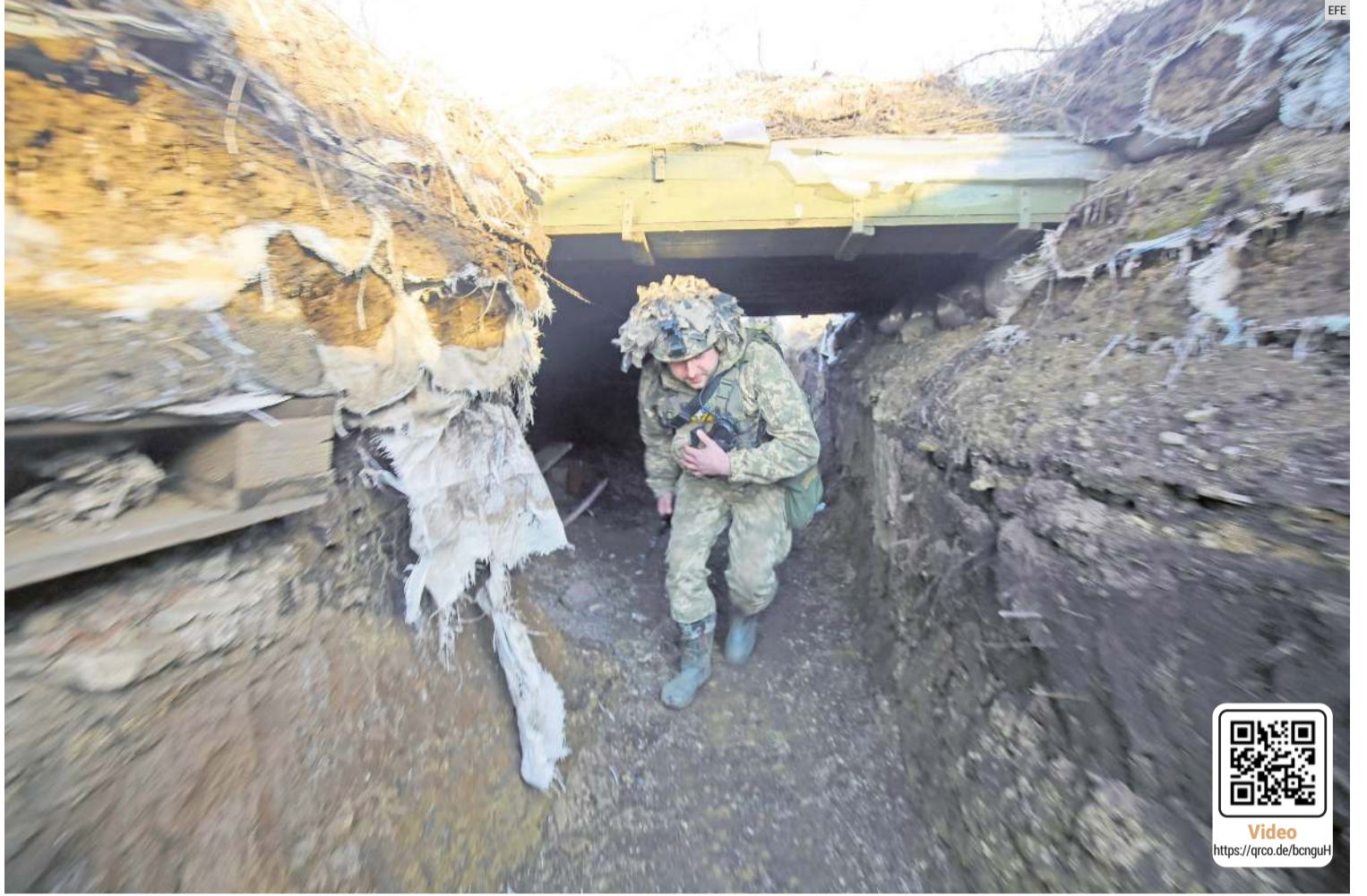
RESISTIRÁN. Fuerzas ucranianas preparan sus posiciones en el área de Donbás para enfrentar la posible invasión rusa.

Comentó que lo anterior podría impactar a México, considerando la bolsa de valores, "pero a lo mejor en la cuestión del combustible podría verse beneficiado, depende las aristas que pudiera tomar también la guerra, insisto, que no ha iniciado... cómo se va a desarrollar el conflicto, la crisis".