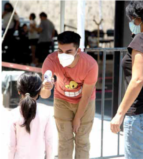
HERRAMIENTAS. La coordinación trabajó para acercar a los jaliscienses a un sinfín de expresiones culturales mediante el formato digital y bajo estrictos protocolos sanitarios.

“Dentro de los proyectos exclusivos que formaron parte de la cartelera digital, destacan colaboraciones con la Compañía Nacional de Teatro, la Compañía Nacional de Danza, el Tea-