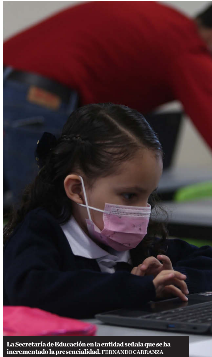
La Secretaría de Educación en la entidad señala que se ha incrementado la presencialidad.

Por su parte, el gobernador Enrique Alfaro Ramírez anunció que la reunión de la Mesa de Salud se adelanta para el próxi-