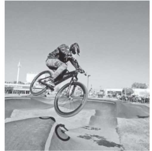
El parque tiene pista para bicross.

Tremari, que se derribó con la construcción de la L3.