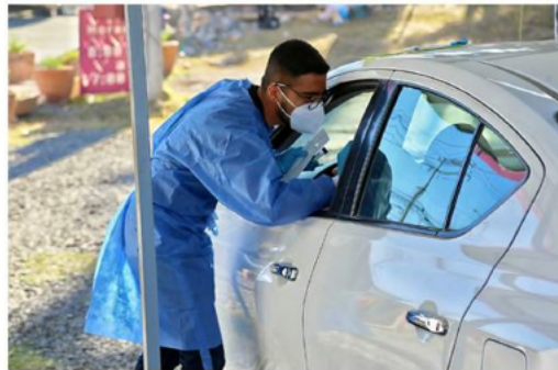
■ En dicho lugar, desde hace 10 días han atendido a mil 800 personas en promedio al día.

Dijo que la Red Universitaria tiene la capacidad de realizar alrededor de mil 100 pruebas diarias de antígenos y PCR, pero dado al incremento en los contagios, se busca ampliar la capacidad de atención a 2 mil 200 personas al día.