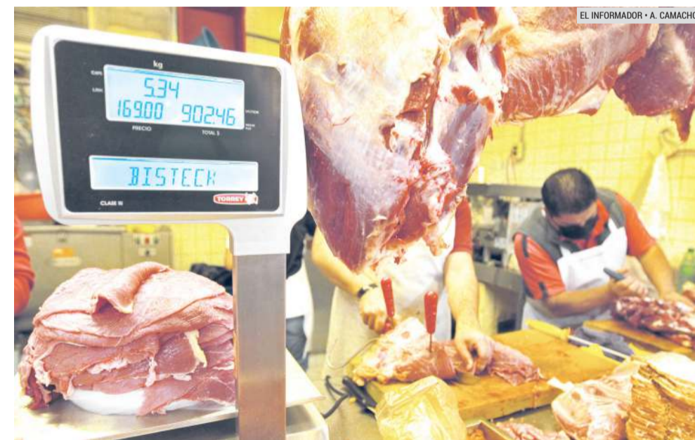
AUMENTO. Hay incrementos de hasta 29 pesos en alimentos, como la carne de res.

VERDURAS: Aguacate, acelga, betabel, calabaza, col, chile poblano, hongos, ejote, elote, espinaca, jitomate, lechuga, papa, tomate, zanahoria.