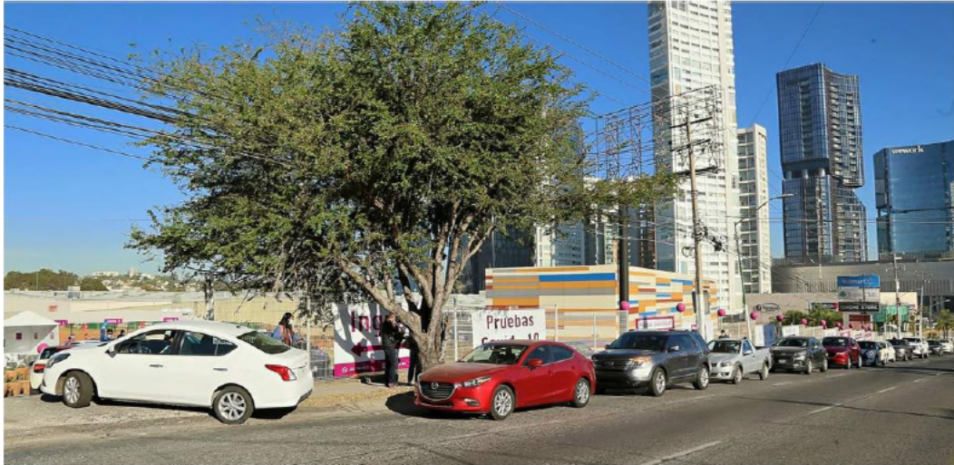
■ En Mediclair Lab Drive Thru, en Avenida Patria, las personas hacen fila en sus autos para aplicarse pruebas.

Aumenta demanda en call center de UdeG para agendar pruebas