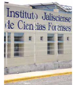
PERSPECTIVA. El organismo exigió que las prácticas cambien y se enfoquen a prevenir más desapariciones.

● Los cuerpos reclamados corresponden a dos jóvenes que fueron encontrados en la fosa clandestina Mirador II en Tlajomulco hace dos años. La autoridad se negaba a entregarlos porque no estaban completos