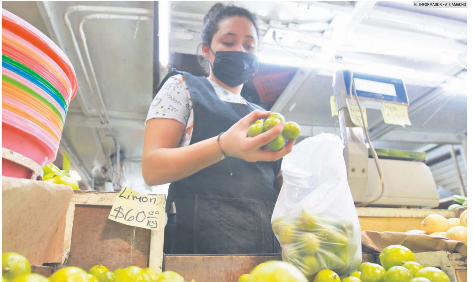
CANASTA. Siete de cada 10 productos de la canasta básica incrementaron su precio.

Reporte De acuerdo con el Reporte de Estabilidad Financiera Segundo Semestre 2021, los aumentos en la inflación obedecen al reflejo de los desajustes entre la oferta y la demanda asociados a cuellos de botella en las cadenas globales de suministro, entre otros.