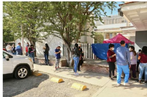
■ También en el UCUS de la UdeG hay filas para aplicarse los reactivos y ver si están contagiados de Covid.

Lo mismo ocurre con la atención brindada en el drive thru ubicado sobre Avenida Patria, a la altura de Avenida Royal Country, donde se realizan pruebas de antígenos, anticuerpos y PCR.