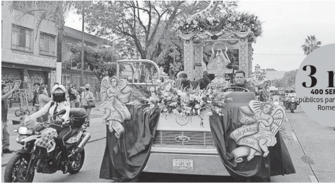
Pese al llamado de no asistencia, la gente se dio cita a La Romería.