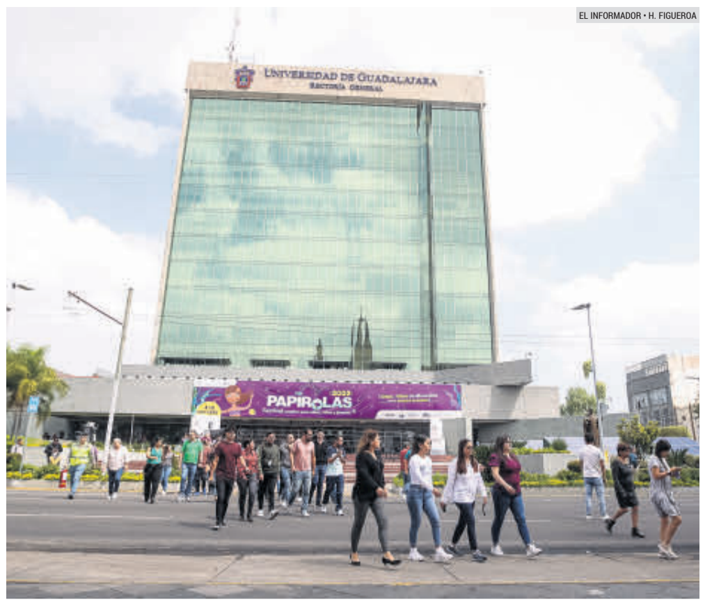
MEJORA. La propuesta del gobernador permitirá a la UdeG planificar sus gastos.

Ambos especialistas coincidieron en que es importante que la UdeG asegure que el presupuesto que corresponde a la Federación por lo menos se mantenga; también indicaron que la institución educativa deberá mejorar su diseño administrativo y de rendición de cuentas, mientras que a la sociedad le tocará revisar que el dinero se vaya a los temas necesarios para la Casa de Estudios.