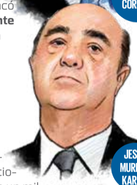
JESÚS MURILLO KARAM