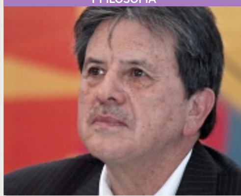
JOSÉ MANUEL VALENZUELA ARCE

Académico e investigador emérito de El Colegio de la Frontera Norte, fue distinguido por su labor en estudios culturales, fronteras, violencia y migración. Es autor de más de 50 libros, entre ellos Jefe de jefes , Corridos y narcocultura en México ; forma parte del Sistema Nacional de Investigadores.