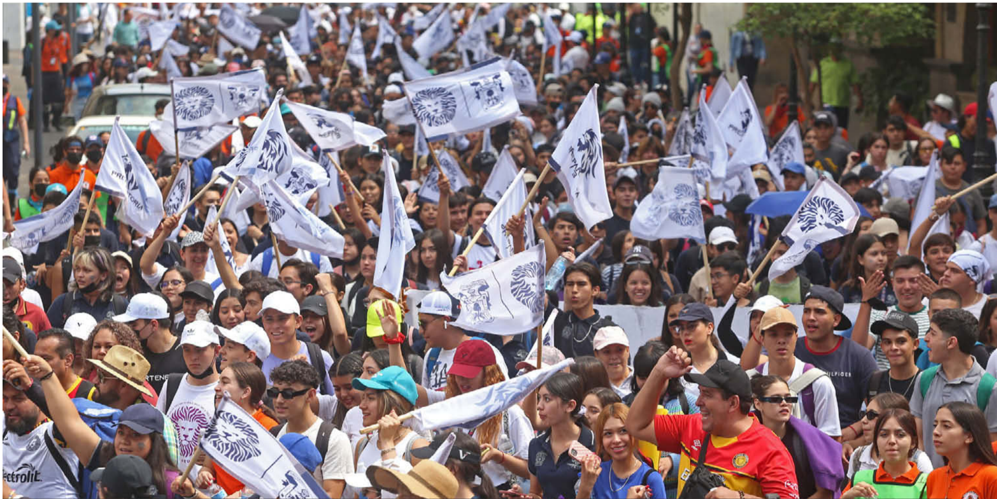
En mayo del año pasado, la UdeG convocó a la segunda megamarcha para exigir respeto a la autonomía universitaria y más presupuesto. FERNANDO CARRANZA