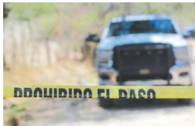
AGRESIÓN. Las búsquedas pararon tras el atentado del 11 de julio en Tlajomulco.