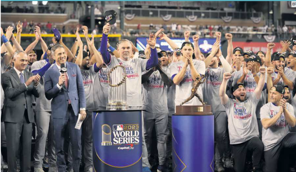
POR FIN. Los Rangers de Texas, una franquicia que existe en las Grandes Ligas desde hace 63 años, conquistó su primer título de Serie Mundial en su tercer intento. El equipo texano había caído en apariciones consecutivas en 2010 y 2011.