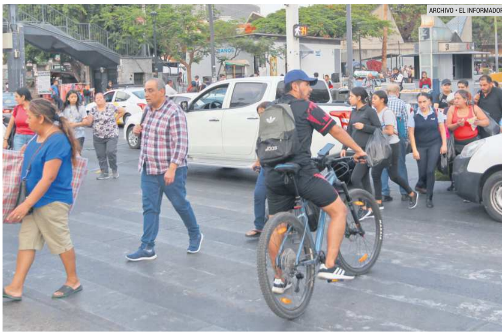
ESTADÍSTICA. Peatones son más vulnerables que los ciclistas o motociclistas.