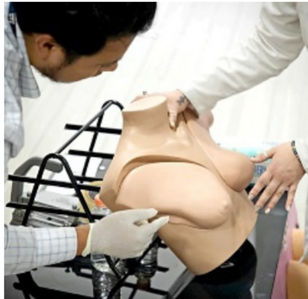
■ Médicos dieron información sobre el cáncer de mama y de próstata, además de realizar pruebas de detección.