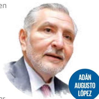
ADÁN AUGUSTO LÓPEZ