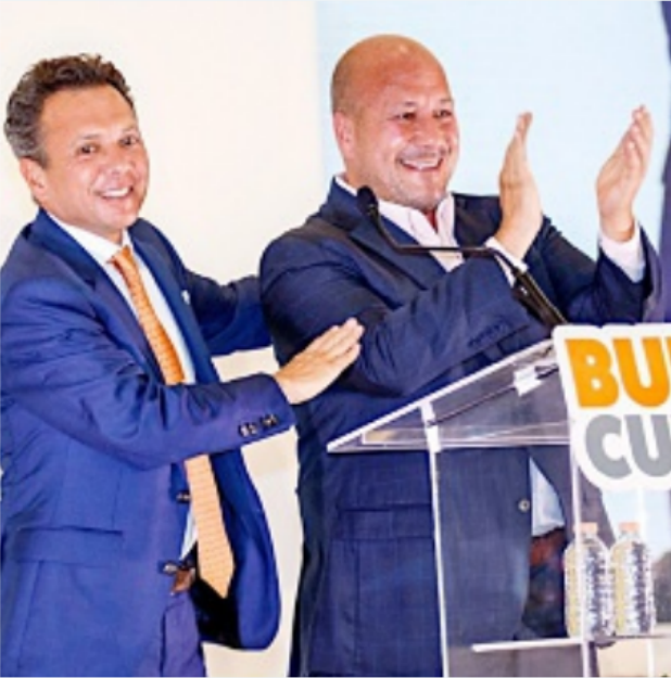
■ Lemus y Alfaro regresarán el domingo de la gira por EU.