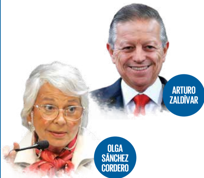
OLGA SÁNCHEZ CORDERO