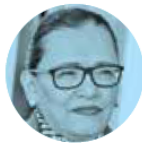
ROSA ICELA RODRÍGUEZ

› Nos cuentan que Pedro Kumamoto anda sembrando el rumor de que será integrado al gobierno de la presidenta Claudia Sheinbaum , y que sería titular del Instituto de la Juventud. Y es que, tras perder la elección a la alcaldía de Zapopan y el registro de su partido Futuro, el joven político anda buscando colarse a la nómina de la 4T.