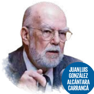
JUAN LUIS GONZÁLEZ ALCÁNTARA CARRANCA

Por lo pronto, ayer la Presidenta Claudia Sheinbaum firmó las reformas constitucionales en materia de vías ferroviarias, con lo cual su-