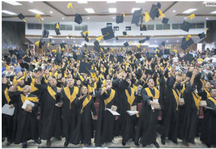
COMUNIDAD ESTUDIANTIL. Se triplicaron los egresados en educación superior.

De manera general, entre los puntos que han impulsado a que cada vez sean más los egresados, señaló la Universidad de Guadalajara, ha sido la ampliación de la oferta educativa, pues con la creación de la Red Univer-