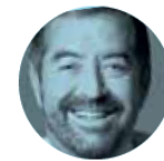
JUAN RAMÓN DE LA FUENTE

› Hablando de la Corte, el ministro Juan Luis González Alcántara tiene a todos los políticos en la expectativa. Integrantes de la 4T y opositores como el priista Alejandro Moreno y el panista Ricardo Anaya le piden adelantar la votación de su proyecto sobre la Reforma Judicial, pero él ni los ve, ni los oye, y reiteró que será el martes.