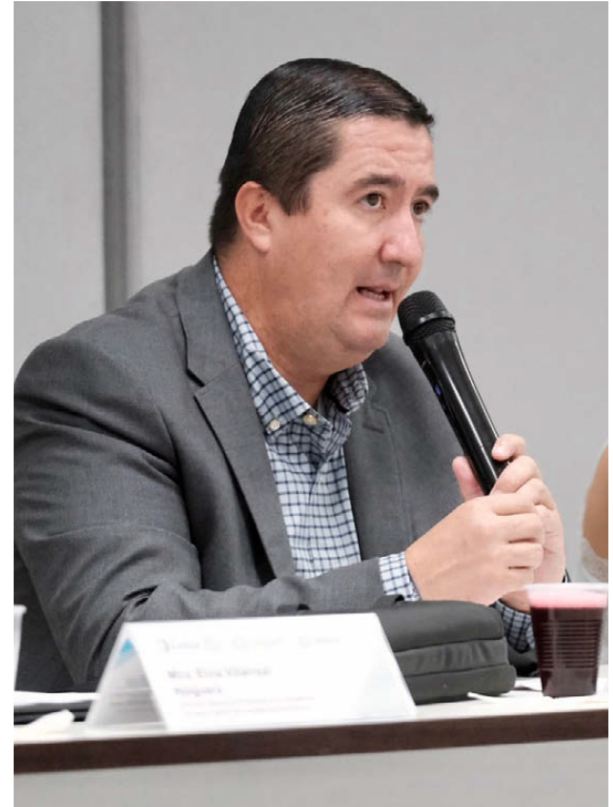
Se han llevado a cabo mesas de trabajo sobre certificaciones de agentes inmobiliarios y retos en mercados digitales. ESPECIAL

Como parte de este convenio se han llevado a cabo mesas de trabajo sobre certificaciones de agentes inmobiliarios y retos en mercados digitales que han contado con la participación de empresarios del sector tecnológico estatal; conferencias sobre la importancia de la política de competencia, la firma de un convenio de colaboración con la Universidad de Guadalajara, y la emisión de recomendaciones de la Comisión al proyecto de Regla-