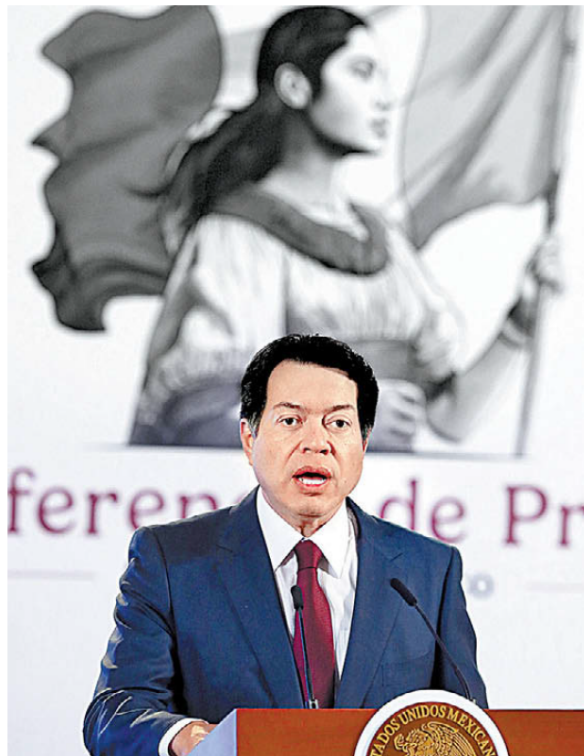
Lamenta que México lidere en obesidad infantil.

“Queremos generar conciencia, la gran apuesta es a la educación, que todos trabajemos en favor de este objetivo, que tengamos una niñez saludable y feliz”, explicó.