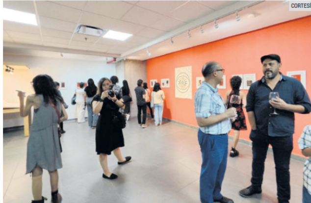
“GEORGE ORWELL: REGRESO A 1984”. La exposición presenta obra del artista visual Sergio Araht.