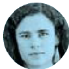
LUISA MARÍA ALCALDE

› Perfil el magistrado del Tribunal Electoral, Felipe de la Mata , avalar que el INE, presidido por Guadalupe Taddei , continúe con la organización de la elección judicial de junio de 2025. El proyecto de sentencia, que será sometido a consideración de sus pares, indica que el proceso “no puede detenerse por parte de la autoridad electoral”.