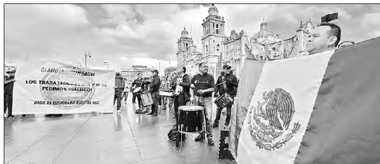
▲ Trabajadores del Poder Judicial que se oponen a la reforma se manifestaron frente a

Facebook, TikTok, Twitter: galvanochoa Correo: galvanochoa@gmail.com