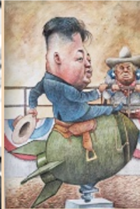
■ La crítica y su manera de expresarla es lo que vio el jurado en el trabajo de Darío Castillejos.