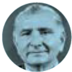
ADÁN AUGUSTO LÓPEZ