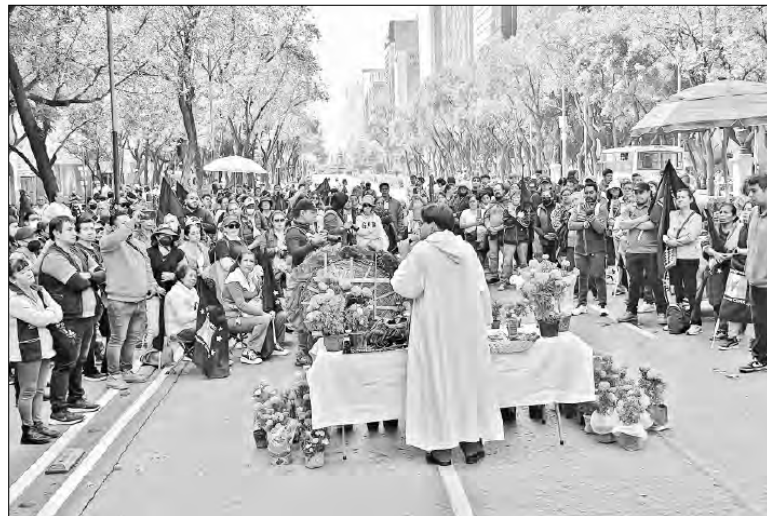
▲ Mientras en Paseo de la Reforma, en CDMX, se realizó ayer una misa por el cura asesinado