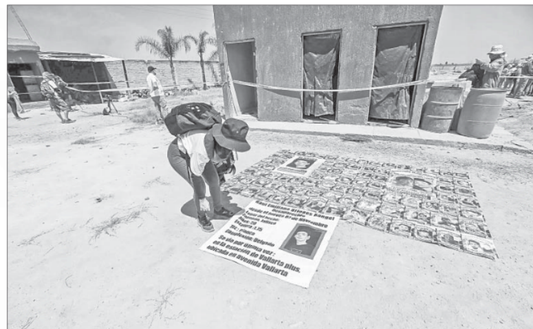
▲ Familiares de desaparecidos que ingresaron ayer al rancho Izaguirre, en Teuchitlán, Jalisco, afirmaron luego de su

Y, MIENTRAS LA Sección Instructora de la Cámara de Diputados (con suficiente mayoría morenista) dictaminó que no se avance en el desafuero del ex gobernador de Morelos Cuauhtémoc Blanco, lo cual será sometido a votación en el pleno de San Lázaro, donde Morena y aliados también son mayoría suficiente, ¡hasta el próximo lunes!