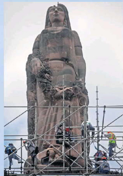
La restauración de la escultura se podría alargar hasta septiembre.

Hoy se restaura el monumento, pero el problema que lo ha resignificado persiste: oficialmente el gobierno de Jalisco reconoce que 15 mil 25 personas siguen desaparecidas en la entidad y más de la mitad (8 mil 560) fueron vistos por última vez en los municipios de Zapopan, Guadalajara, Tlajomulco, Tlaquepaque y Tonalá. ●