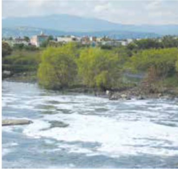
ARCHIVO NTR / MPN

“¿Cuántos programas tenemos los últimos 10, 15 años de proyectos, de vamos a sanear el río y vamos a invertir quién sabe cuántos miles de millones de pesos, hacer recorridos, tomarse un buche de agua incluso, etcétera, y no pasa nada?, ¿quién realmente evita que esto tenga solución? Es muy complejo porque la organización a lo largo de la (cuenca) Lerma-Chapala-Santiago es muy difícil de corregir si no se corrigen (acciones) mediante