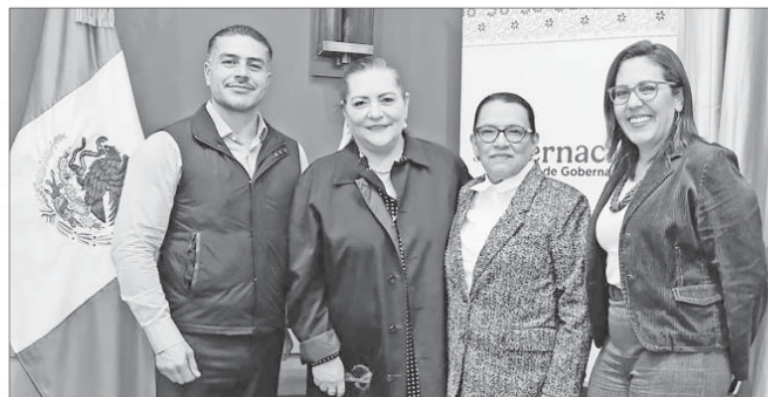
▲ La secretaria de Gobernación, Rosa Icela Rodríguez, se reunió ayer con la presidenta del INE, Guadalupe Taddei; el titular de la SSPC, Omar García Harfuch, y la consejera