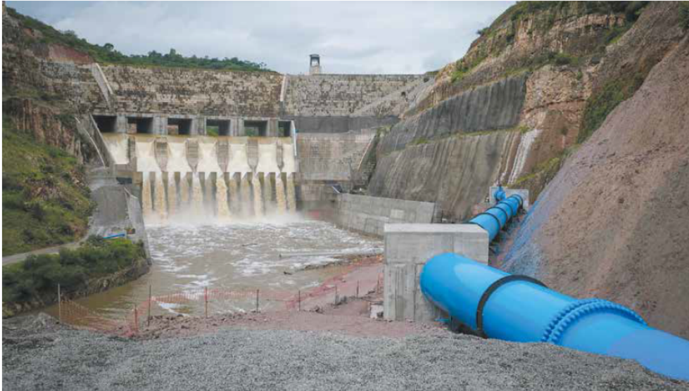
EMBALSE. La ASF encontró pagos en exceso por 37.8 millones de pesos correspondientes a la instalación de tuberías en El Zapotillo, presa finalmente inaugurada en 2024.