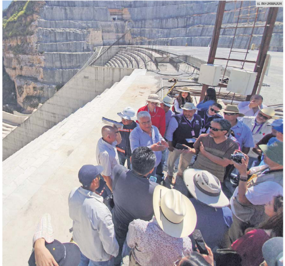
OPACIDAD. La anterior administración estatal dejó pendiente aclarar cuentas en obras, como El Zapotillo.

Además, la Universidad de Guadalajara enfrenta una observación por 45.5 millo-