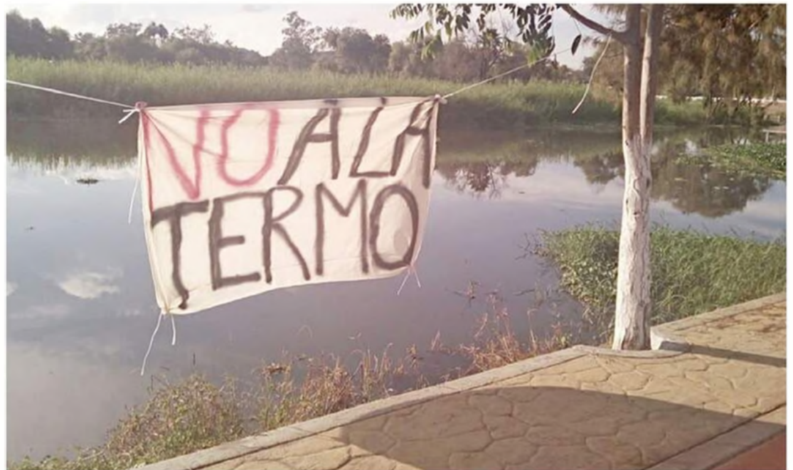
■ Recientemente, la Presidenta anunció la instalación de una planta de ciclo combinado en Jalisco.

“Lo vemos como una afrenta a la sociedad. Creo que hay otras formas de solucionar problemas de energía y todo lo demás, ¿pero contraponer el futuro de la sociedad en términos ambientales por un ‘bien’ de corto plazo? ¿A quién le va a servir eso? ¿A una nueva industrialización