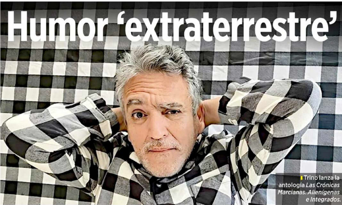
Trino lanza la antología Las Crónicas Marcianas. Alienígenas e Integrados .