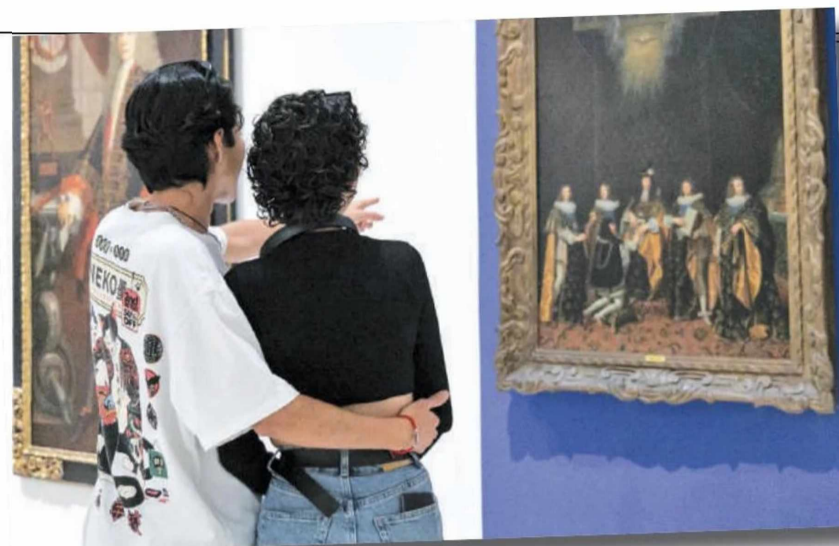
Los secretos del color en MUSA.

En colaboración con: Trilce Ediciones Curaduría: Trilce Ediciones Termina el 16 de marzo de 2025 ●