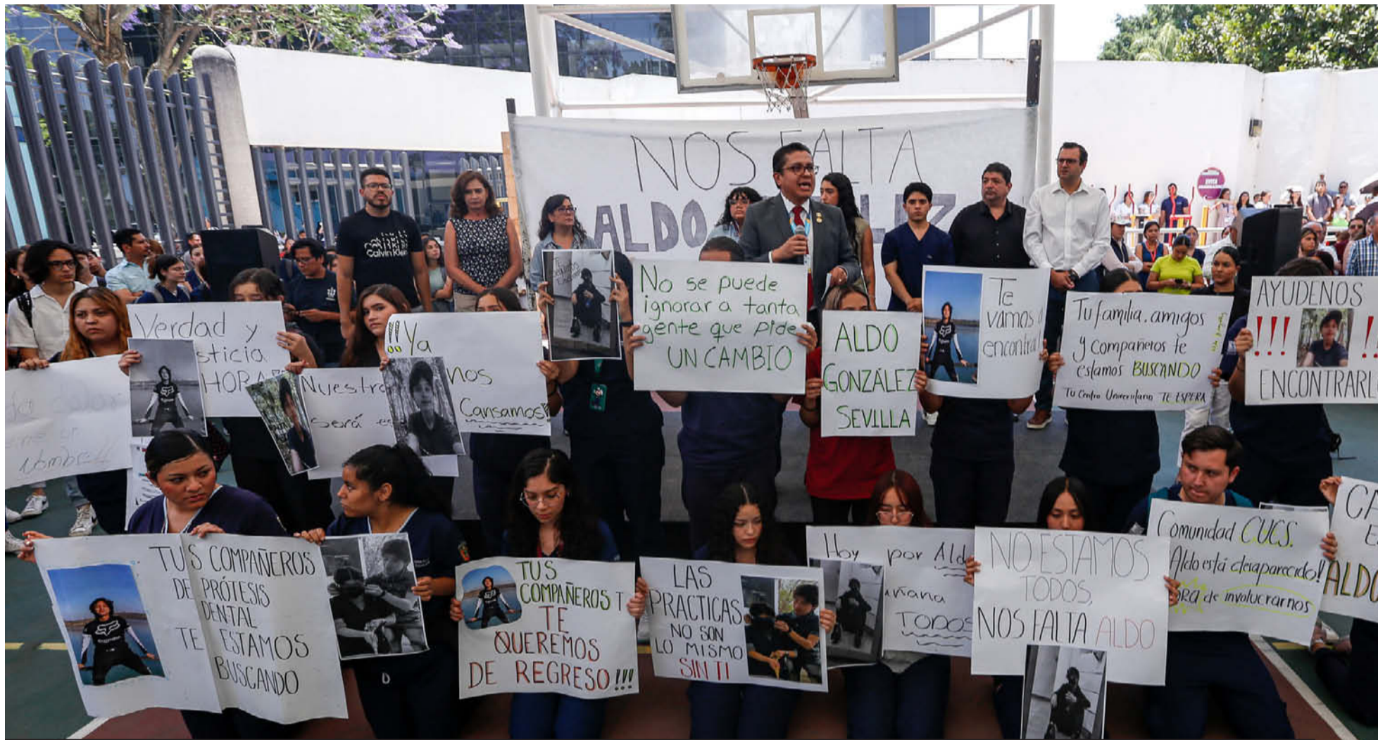
El universitario dijo que si hubiera mejores autoridades no estarían en esta situación.