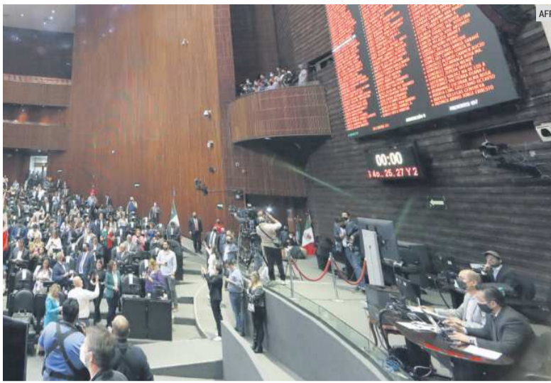
OBSERVADOS. El pleno del Congreso de la Unión podría determinar si procede o no esta reforma.

Se prevé que las modificaciones a la Ley de Amparo sean discutidas en el Congreso de la Unión donde los diputados de oposición ya advirtieron que tramitarán una acción de inconstitucionalidad.