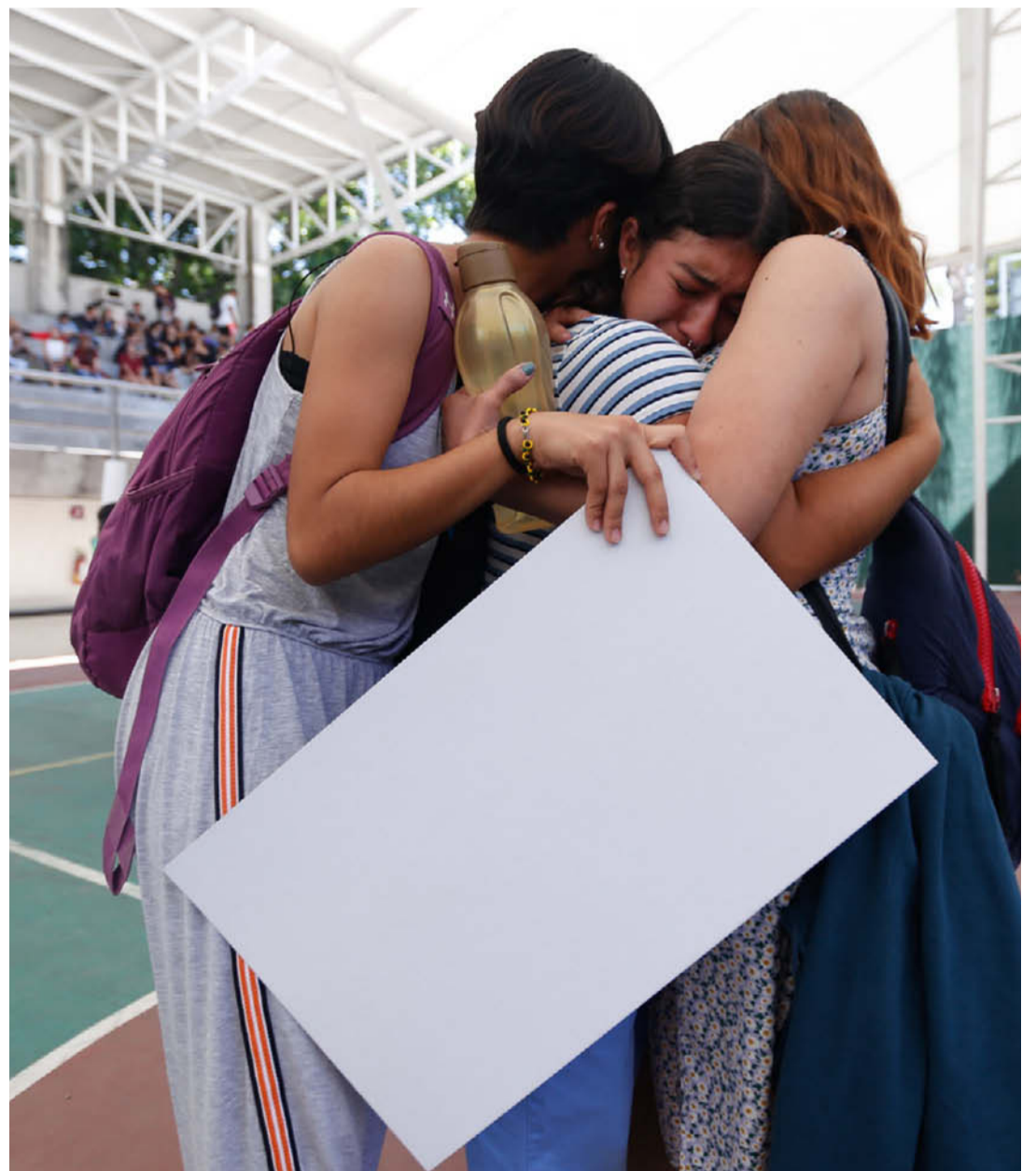
Acusan de revictimización a las autoridades.

En punto de las 12:00 horas, la comunidad estudiantil y ad-