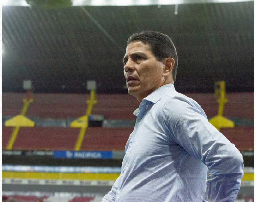
Sosa quiere su segundo título con Leones Negros.

Todavía tenemos la espina clavada de lo que sucedió el torneo anterior en la semifinal, somos conscientes de que debimos hacer una mejor fase semifinal, nos quedamos cortos, los números ahí están, el equipo se ha ganado un respeto, es un equipo que le gusta poner la pelota al piso y jugar, siempre buscando ganar en casa o fuera y en este momento le veo oficio, la experiencia que puedes tener para