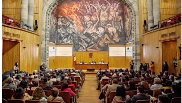
El consejo universitario aprobó la creación del programa para apoyar a Temacapulín, Acasico y Palmarejo.

"Desde la Universidad luchamos para que toda la evidencia científica de los especialistas en agua y problemas sociales demostraran que no había razón para inundar estos pueblos (...) me conmueve ver como nuestra congruencia llega siempre a buen puerto", dijo en su intervención.