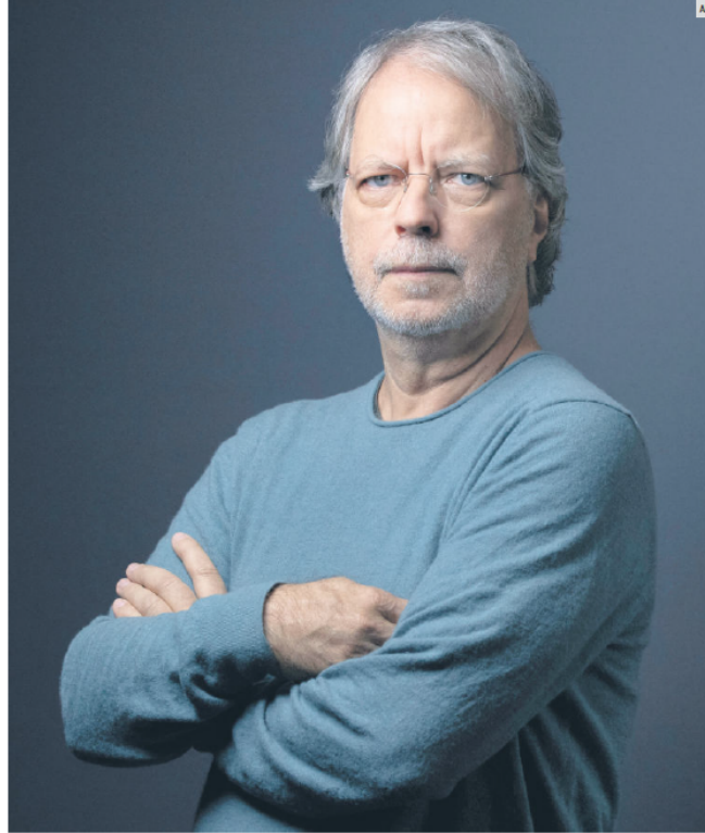
MIA COUTO. El premio FIL de Literatura en Lenguas Romances 2024 será el encargado de la primera sesión de “Mil Jóvenes con...”.