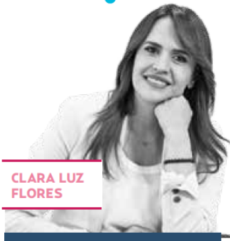
CLARA LUZ FLORES

› A invitación de la presidenta Sheinbaum, Clara Luz Flores se integra al equipo de la secretaria de Gobernación. Rosa Icela Rodríguez . Será la titular de la Unidad de Asuntos Religiosos, Prevención y Reconstrucción del Tejido Social, para lo cual solicitó ayer licencia al cargo de diputada federal. Es decir, vuelve al equipo de Rosa Icela, pues cuando ésta fue secretaria de Seguridad Pública, Clara Luz ocupó el Secretariado Ejecutivo del Sistema Nacional de Seguridad Pública.