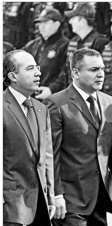
▲ En imagen de archivo de octubre de 2010, el entonces presidente, Felipe Calderón y Genaro García Luna, quien era titular de la Secretaría de Seguridad Pública.

X, antes Twitter: @cafevega cfmexico_sa@hotmail.com