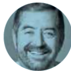
JUAN RAMÓN DE LA FUENTE

› Coincidió el dirigente del PAN, Marko Cortés , con la presidenta Sheinbaum y Morena en que el ex presidente Felipe Calderón explique y pida disculpas a México por haber cobijado en su gobierno a Genaro García Luna , sentenciado en EU a más de 38 años de prisión por narcotráfico. Incluso atribuye al ex mandatario la debacle del panismo.