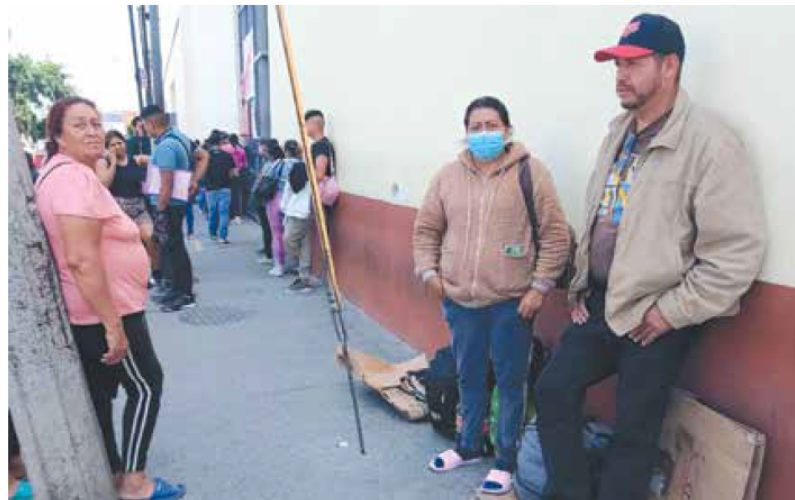
ESTÁ FUERTE. A las afueras del Civil hay varias familias a la espera de noticias de sus seres queridos internados por dengue.

Ante el aumento de casos, esta semana el titular de la SSJ, Fernando Petersen Aranguren, descartó saturación en los hospitales: "Ahorita en todos los hospitales el