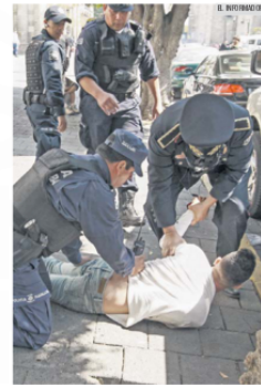
ZONACENTRO. Es una de las zonas donde los delitos de este tipo suceden de forma más frecuente; señala la Policía.

Los motoladrones siguen cometiendo ilícitos: por ejemplo, el pasado 19 de febrero, fue captado en video cómo un motoladron le arrebató su celular a una joven mientras se encontraba en un parabús de la Colonia San Juan Bosco de Guadalajara. El criminal se subió a la banqueta en su motocicleta para cometer el robo.