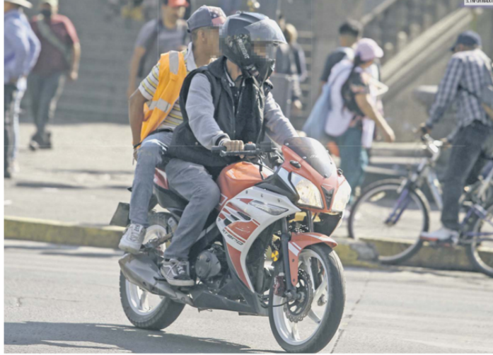
REGULACION NECESARIA. Expertos en seguridad señalan la importancia de imponer reglas para el uso y circulación de este tipo de vehículos.

El celular y las tarjetas bancarias suelen ser los más robados por estos delincuentes