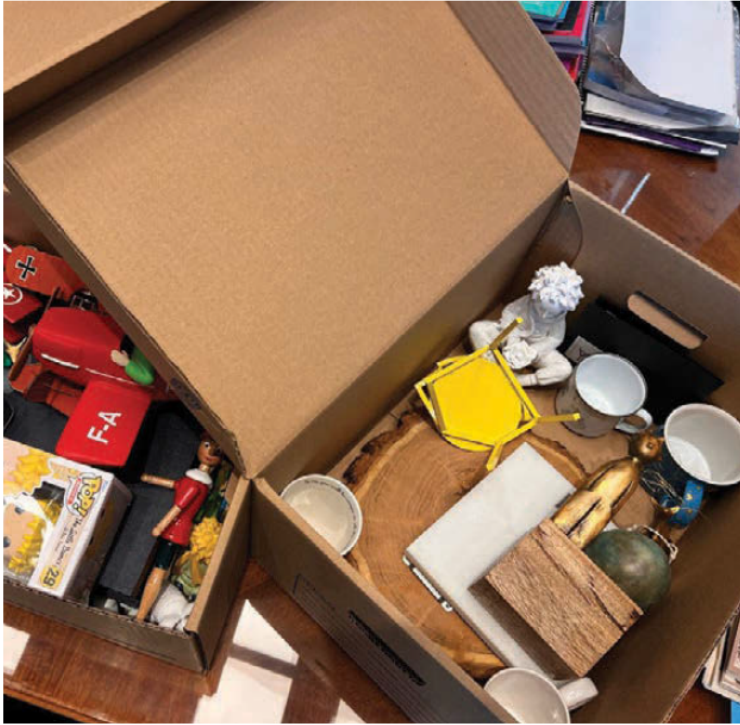
El ex rector de la UdeG ya empaca sus últimas pertenencias antes de dejar su cargo como dirigente de la universidad.