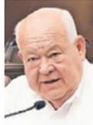
Victor Castro Cosío

:::: El que anda “mal y de malas” en Baja California Sur, nos platican, es el gobernador Victor Castro Cosío (Morena), pues se le juntaron varios reclamos en tiempos electorales. Nos detallan que, en Los Cabos, transportistas privados colapsaron un día el tráfico, ocasionando que muchos turistas perdieran sus vuelos, en reclamo de presuntos abusos de inspectores de transporte estatal, pero también enfrentó un fuerte reclamo de los suyos, los maestros, quienes le reprocharon la promesa incumplida de regularizar todas las plazas y, en una reunión, los ánimos subieron de tono, lo abuchearon y don Víctor les gritó, por lo que ahora sus detractores aseguran que, además de no resolver, “anda de mecha corta”. ¡Serenidad y paciencia, don Víctor!