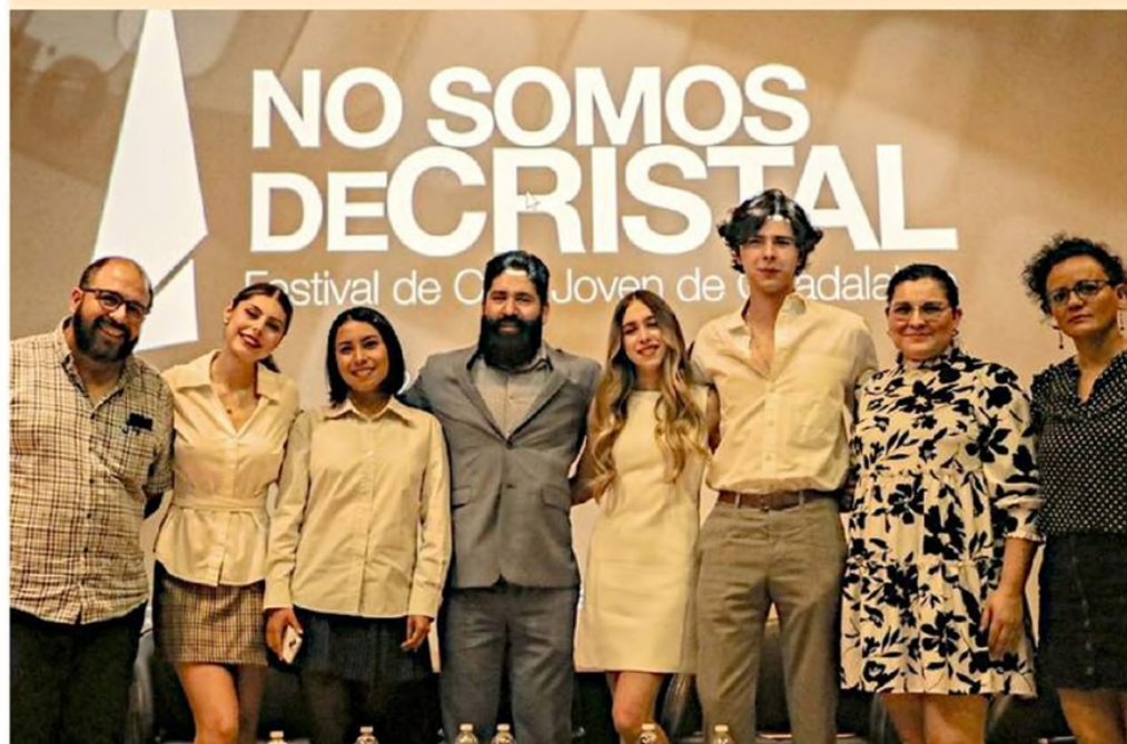
Algunos organizadores de No Somos de Cristal: Festival de Cine Joven de Guadalajara.

El programa del evento, que tendrá como sedes el Tec y el Museo Cabañas, está disponible en el Instagram @nosomosdecristalfest.