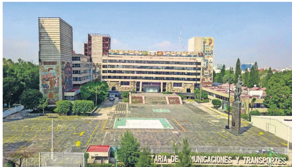
El Centro Scop, hoy y en 2022, visto desde Eje Central. Los murales originales fueron retrados por secciones y actualmente los resguardan en la explanada del predio. Las réplicas, instaladas después del terremoto de 1985, se encuentran en bodegas.

En esta fase también se trabajaron los estudios de preinversión (técnicos, de impacto social, urbano, ambiental y económico) y el Proyecto