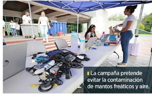
La campaña pretende evitar la contaminación de mantos freáticos y aire.

En los centros de acopio se podrán recibir, entre otras cosas, computadoras, aspiradoras, licuadoras, impresoras, secadoras de cabello, pantallas, así como pilas de ácido