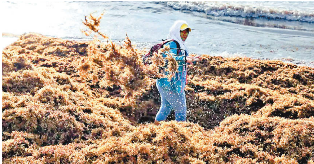
- Invasión. Estas algas pueden acumularse en grandes montañas de varios kilogramos.

Boca Paila y Punta Allen se encuentran dentro de la Reserva de la Biosfera de Sian Ka'an, la cual tiene más de 528 hectáreas y una población de apenas 634 habitantes. Esta reserva es única en la región y en el mundo por los servicios ambientales que brinda y debido a sus características se podrían encontrar especies de nemátodos aún desconocidas. La Comisión Nacional de Áreas Naturales Protegidas (Conanp)