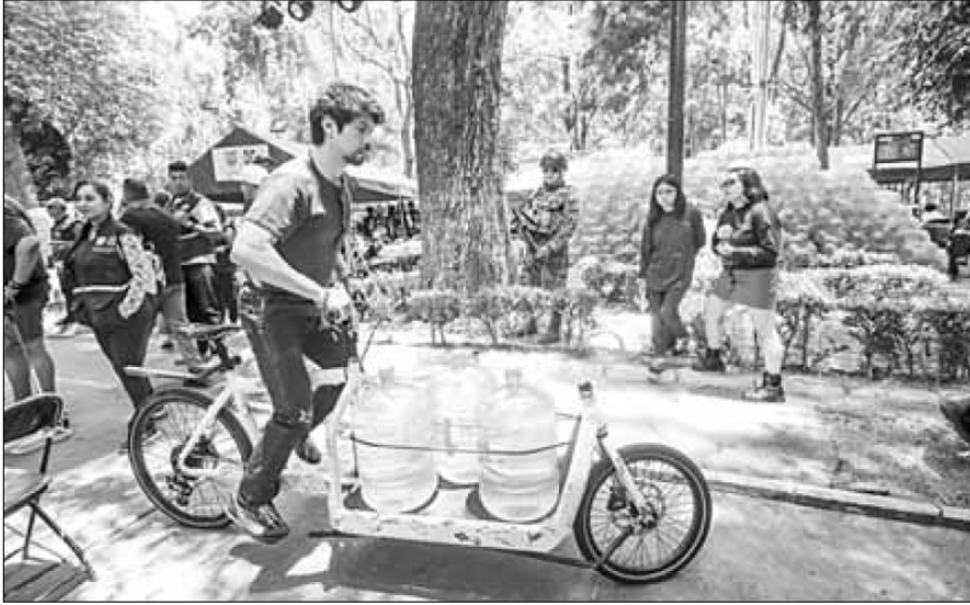
▲ Residentes de la alcaldía Benito Juárez afectados por el desabasto del líquido se las

ingenian para llevar garrafones de agua purificada a sus hogares.