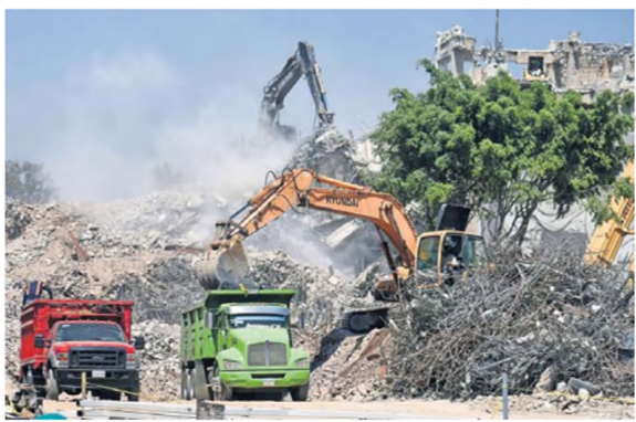
La demolición de los edificios del Centro Scop no para, lleva un progreso del 95%.

En febrero de 2023, el grupo civil en Defensa del Centro Scop había dado a conocer cómo se vería el parque y en la página web https://parquemuralismomexicano.mx/proyecto/ hay renders sobre el Parque, donde se pueden ver por ejemplo que el alto relieve de Francisco Zúñiga no está en su posición original. La Secretaría dijo que esos proyectos no son las versiones finales y que