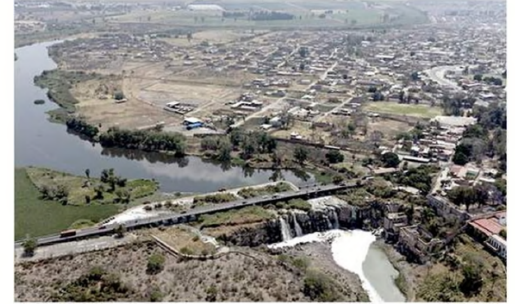
El proyecto aportará información científica para atender los impactos biofísicos en el Río Santiago.

El objetivo, añadió, es transparentar la información pública con respecto a evidencias y conocimientos sobre las relaciones del Río Santiago con las poblaciones, empresarios y gobiernos.