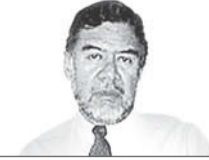
Carlos Pallán Figueroa

Pie de página: Las medidas del presidente argentino siguen causando una inconformidad creciente en el ámbito científico y académico. La Red Argentina de Carreras de Sociología emitió una declaración pública sobre lo que está ocurriendo. Aquí se puede ver: t.ly/8ZjSF