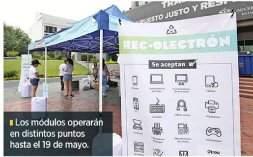
Los módulos operarán en distintos puntos hasta el 19 de mayo.

versidad Nacional Autónoma de México, el mal tratamiento de la basura electrónica afecta a los mantos freáticos, desde donde se extrae el agua para consumo; también causa contaminación en el aire.