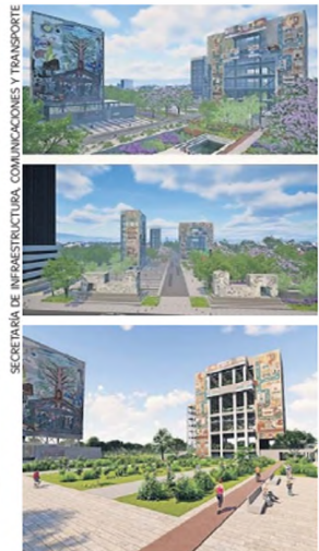
Renders de primeras versiones del que será el Parque del muralismo.

lo que está en la página web es caché. "El proyecto actual considera el respeto a la lectura original de los murales. No van a cambiar de ubicación, se respeta la sombra y la disposición de los murales".