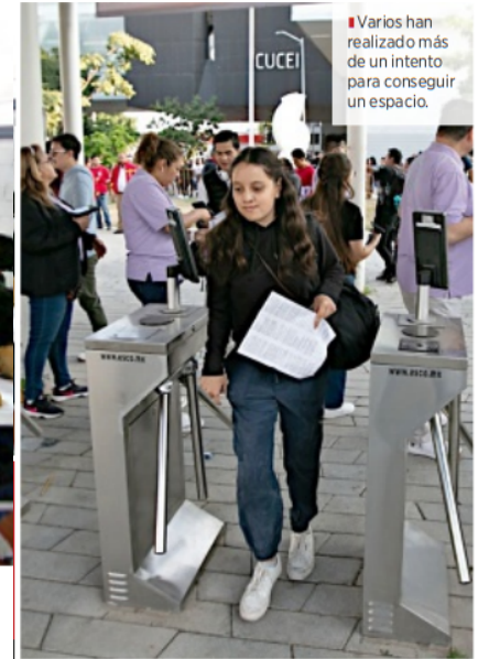
Varios han realizado más de un intento para conseguir un espacio.