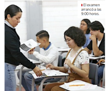
El examen arrancó a las 9:00 horas.

La académica recordó que tras la prueba, se debe realizar la entrega de documentos a la UdeG; el dictamen con los resultados se dará a conocer el 13 de enero de 2025.