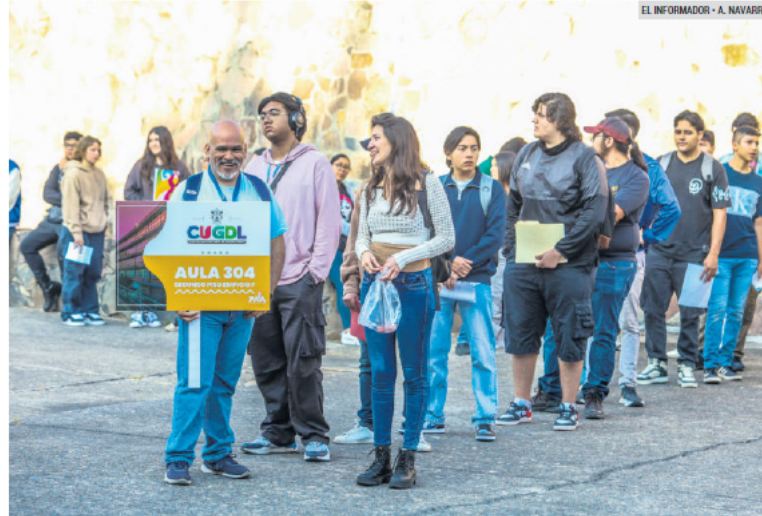
LISTOS. Unos nerviosos y otros confiados, los estudiantes presentaron ayer la prueba de ingreso.

Ingenierías (CUCEI), con cuatro mil 145.