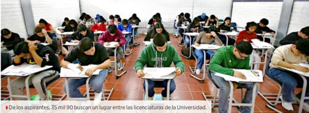
De los aspirantes, 35 mil 90 buscan un lugar entre las licenciaturas de la Universidad.