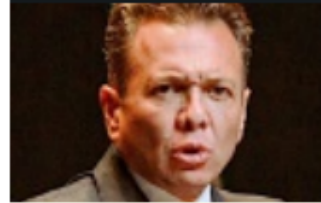
Pablo Lemus Gobernador electo

/// ¡No se ve el compromiso ni el cariño por el pueblo de Jalisco! (...) Vamos a luchar para que Jalisco obtenga lo que merece".