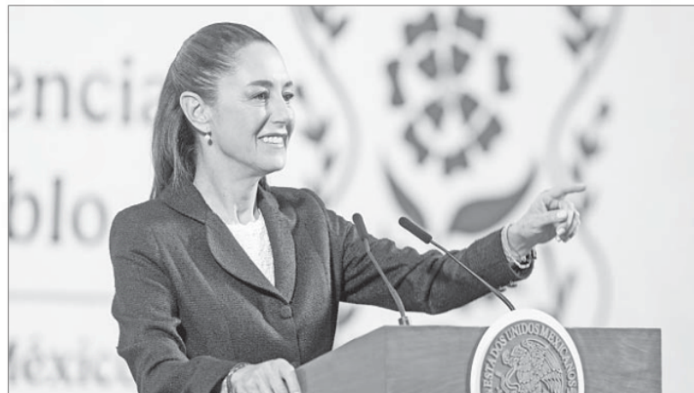
▲ La presidenta Claudia Sheinbaum Pardo destacó, en la conferencia de prensa de ayer en Palacio Nacional, la presencia de los