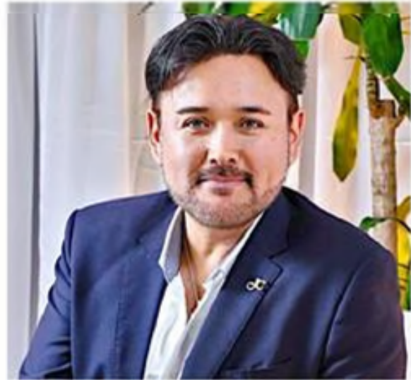
■ Javier Camarena.

mo por volver a cantar en el País y reencontrarse con el público.