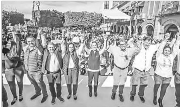
▲ En su visita ayer a León, Guanajuato, Claudia Sheinbaum señaló que es "absolutamente falso" que funcionarios de la STPS hayan