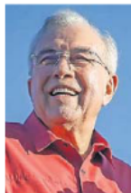
Rubén Rocha Moya

:::: El que aplicó el “¿ya se va?” en Sinaloa, nos cuentan, fue el gobernador Rubén Rocha Moya