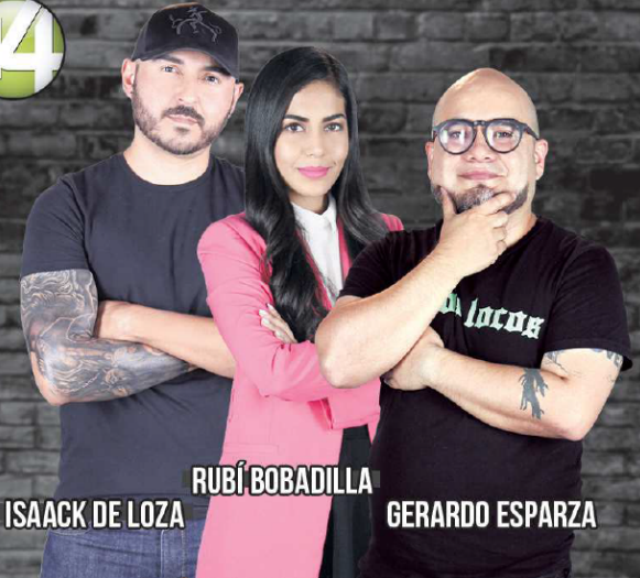
ISAACK DE LOZA

REVIVE LA ENTREVISTA EN EL SÓTANO CON EL PRESIDENTE DEL SISTEMA ESTATAL ANTICORRUPCIÓN