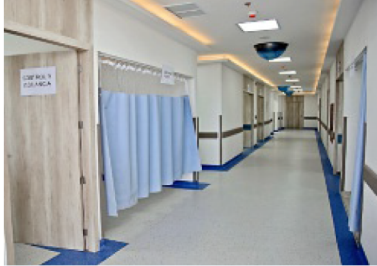
■ El nuevo nosocomio contará con 36 consultorios.