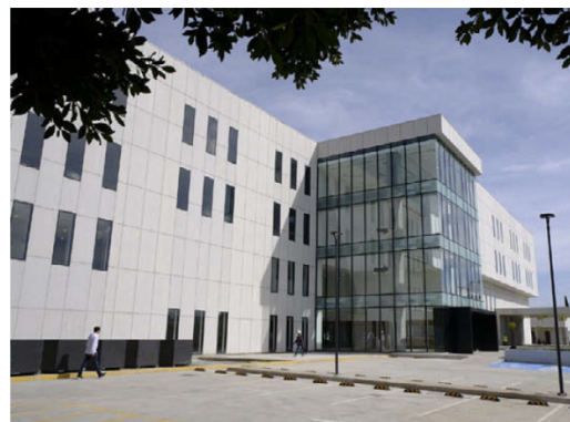
El nosocomio está en la colonia Miramar, en Zapopan.

Este Hospital de tercer nivel estará especializado en el diagnóstico y tratamiento integral de neoplasias malignas, brindará atención a la población sin seguridad social. ■