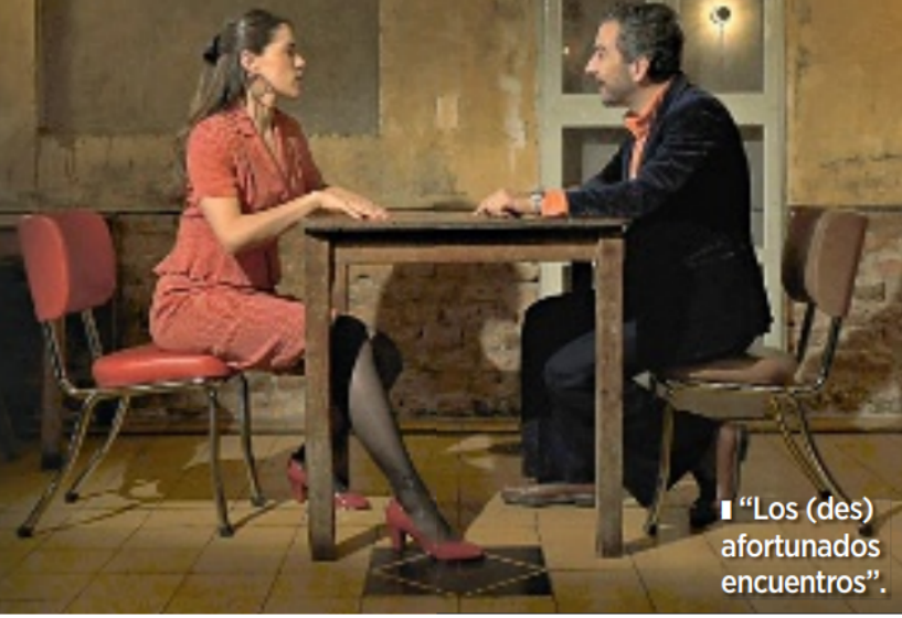
■ "Los (des) afortunados encuentros".

El Ciclo Focus The Body será el 14 de enero, a las 16:00 horas, en la Sala 1 de la Cineteca FIGG.