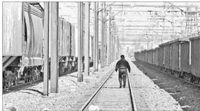
▲ Pese a las promesas de Ernesto Zedillo, la iniciativa privada construyó sólo 301

Twitter: @cafevega cfmexico_sa@hotmail.com