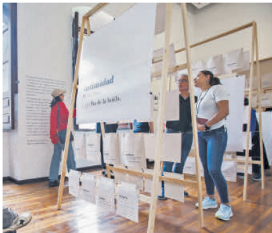
“VOCES PERIFÉRICAS”. Es una exploración visual del lenguaje en el Museo Cabañas.

Por otro lado, “Juegos de niños”, de Francis Alÿs, es una serie de videos que documentan juegos infantiles en distintas regiones del mundo, destacando su valor sociocultural y etnográfico. Los videos, que estarán disponibles hasta el 6 de abril de 2025, capturan la capacidad de los niños para crear sistemas sociales autónomos en medio de contextos adversos, reflejando la esencia de la infancia compartida y la adaptabilidad humana.