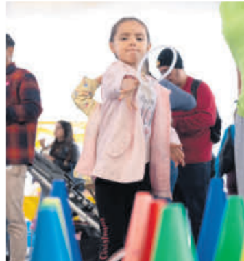
“JUEGOS DENIÑXS”. Un vistazo a la manera en cómo se divierten las infancias.

El MAZ, en Zapopan, destaca por su exposición “Constelaciones: Transgenealogías y alianzas invisibles”, del artista Santiago Borja. Inspirada en la antropología estructural de Claude Lévi-Strauss, esta muestra explora las relaciones simbólicas de parentesco y los tipos de alianzas que surgen más allá de la filiación biológica. “Constelaciones” estará abierta hasta el 2 de marzo de 2025.