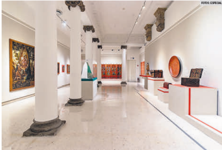
LOS SECRETOS DEL COLOR. Descubre el lado íntimo de la historia en el MUSA.

Además, en el marco de la Feria Internacional del Libro de Guadalajara (FIL), España, como país invitado, presentará en el MUSA la muestra “Foodscapes”. Esta exposición, que representó a España en la reciente Bienal de Arquitectura de Venecia, examina el contexto agroarquitectónico de ese país, abordando temas globales sobre sistemas alimentarios y las arquitecturas que los sustentan. Con una mirada hacia el pasado y el presente de la producción de alimentos, “Foodscapes” invita a los espectadores a reflexionar sobre la sostenibilidad y las prácticas agrícolas.