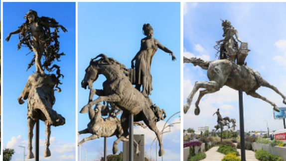
■ Si bien el conjunto escultórico de Sergio Garval, ubicado en Lázaro Cárdenas, llamado "Las Tres Gracias" fue bien recibido, su entrega se retrasó y el autor tuvo que pagar una multa. Con el paso del tiempo algunas de las piezas que lo integran han sido robadas.