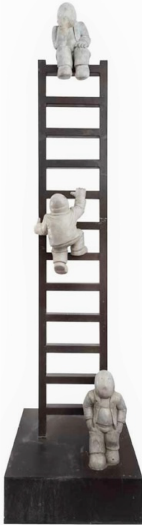
■ "Big Steps", de Rodrigo de la Sierra, fue la inspiración para la escultura monumental que compró el Gobierno de Jalisco en 4.3 millones de pesos y que se llama "Big, Big Steps".