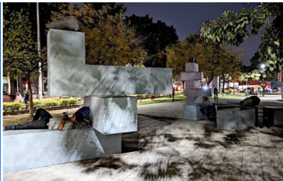
■ José Dávila llevó el arte público al Parque San Jacinto con "Conjunto Escultórico", de manera que los habitantes pudieran convivir con las esculturas.