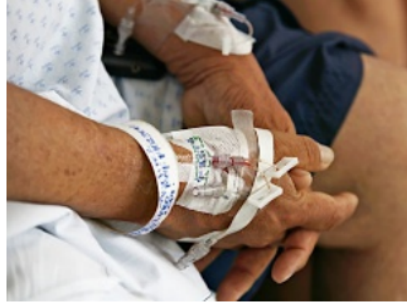
Los adultos mayores corren riesgo de contraer enfermedades por ocupar una cama del nosocomio estando sanos.