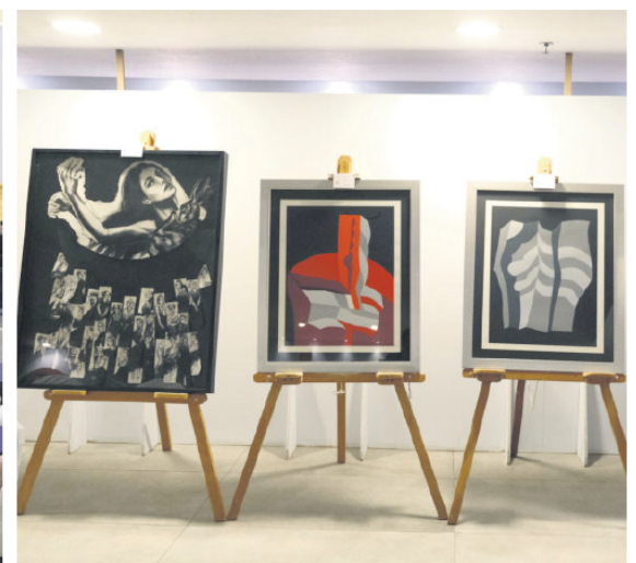
ARTE. Piezas del catálogo que fue puesto en subasta.