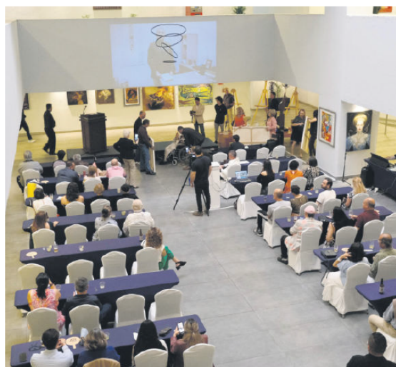
EVENTO. Homenaje por los 27 años de trayectoria de Galería Vértice.