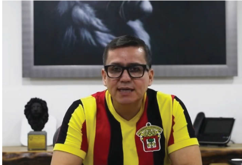
El académico dio a conocer su decisión a través de un mensaje en redes sociales. ESPECIAL