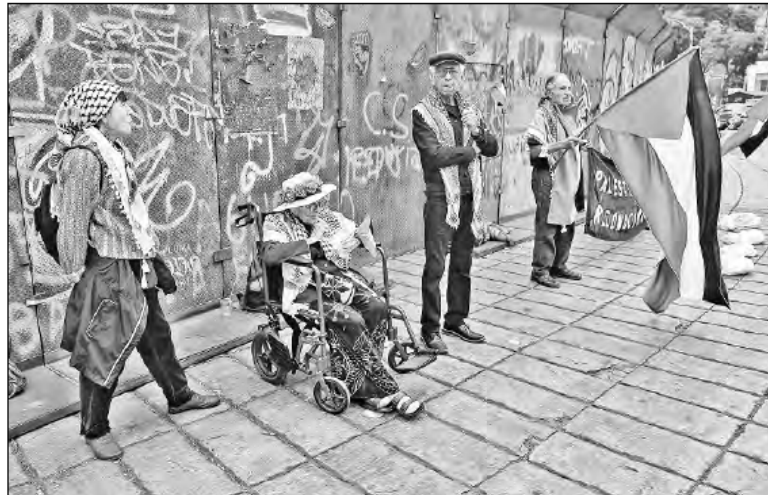
▲ Integrantes de distintos colectivos protestaron ayer en la glorieta del Ángel de la