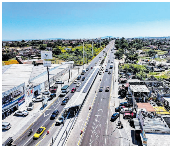
Mi Macro Periférico Tonalá será una realidad.

este es el primero en todo México y eso hace que tenga doble valor", indicó Alfaro.