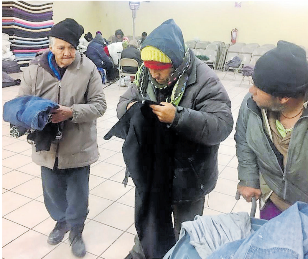
Exhortan a adultos mayores aplicarse el cuadro completo de vacunación.

Adicionalmente tenemos células y proteínas que nos protegen que son antibacterianas y mecanismos que nos impide tener una neumonía quienes tienen riesgo, las personas que tienen alteraciones siendo el principal factor que altere esto el tabaquismo". El 30 por ciento de las neumonías se asocia a neumococo. En el 2022 neumonía e influenza fueron la cuarta causa de muerte en comparación con el 2012 que fue la octava causa de mortalidad en la entidad. Se estima que al día más de 30 personas tienen riesgo de enfermarse por neumonías y bronconeu-