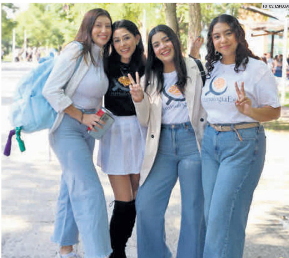
BUEN CAMINO. Estudiantes de la Universidad de Guadalajara celebran los avances en equidad de género y espacios seguros en la institución.