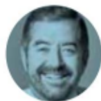
JUAN RAMÓN DE LA FUENTE

› Y donde sigue la mata dando es en la cúpula del PAN. Sus diputados interpusieron ante el TEPJF una impugnación contra el Comité de Evaluación formado por el Congreso. Cuestionan la afinidad de los perfiles con la 4T. Y su dirigente Marko Cortés acusó que Morena ha emprendido una persecución contra quienes se oponen a la reforma al PJ.