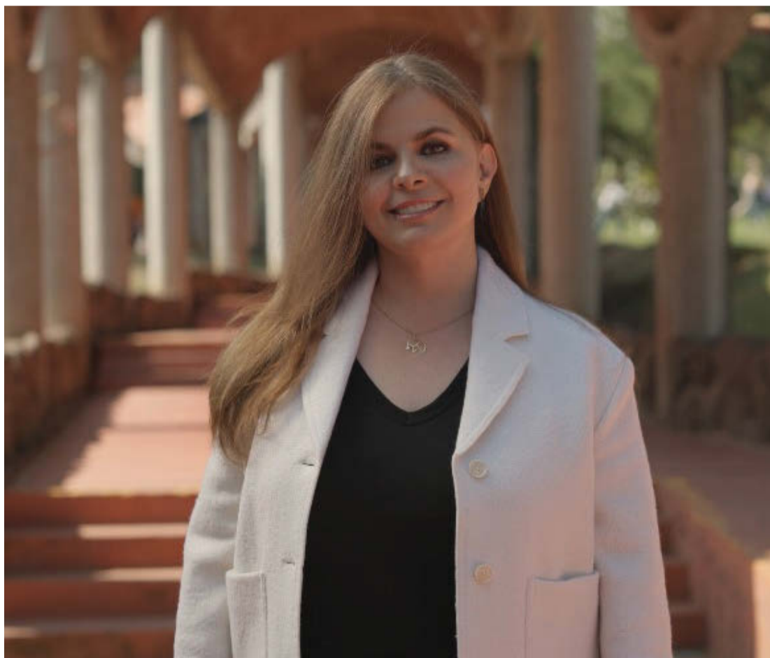
Actualmente es rectora del Centro Universitario de los Altos. ESPECIAL

Planter es doblemente felina: Puma por la UNAM y Leona Negra por la UdeG. De la segunda quiere ser la primera mujer rectora general. A esta casa de estudios regresó después de terminar sus estudios en la Ciudad de México, y de tocar el infierno, como ella misma dice con sarcasmo, por una experiencia personal de vida de la que hablará más adelante. Volvió, dice, para hacer carrera académica desde el puesto más modesto. Su relación con la Universidad de Guadalajara empezó cuando su hermana la llevó a una cabina para que experimentara cómo es la radio en vivo. Desde niña mostró cualidades para la locución. Grababa sus charlas en casetes de bobina que eran parte de colecciones musicales de sus hermanos. Las grabaciones de sus entrevistas borraban de forma automática los éxitos de los artistas del momento o de los clásicos que habían sido atesorados con ahínco. “Qué bueno que mis hermanos lo descubrieron muchos años después”, dice y suelta una risa enseñando sus dientes blancos que parecen tan fuertes como para romper las nueces.