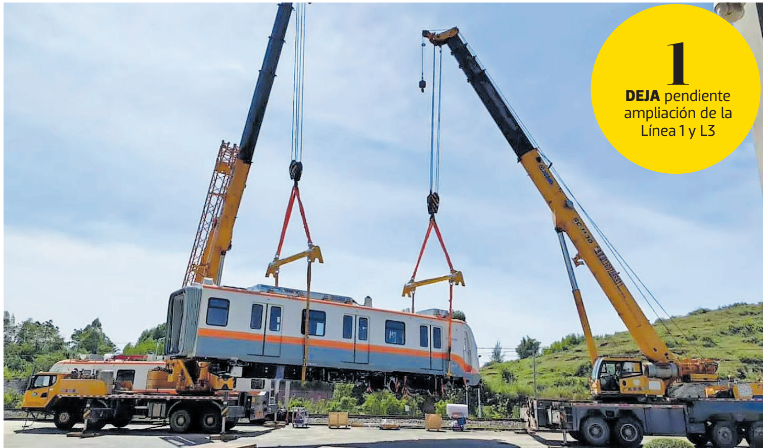
Apunto de llegar los vagones de la L4 que viajan en barco.

Desde ese momento las confrontaciones y desacuerdos con el presidente electo (también en ese momento) Andrés Manuel López Obrador comenzaron ya que no tenían las mismas ideas y conceptos de gobernar y mucho menos de que las decisiones se tomaran desde el centro, siendo Jalisco la cuna del federalismo y la división de poderes. Ante la negativa de entregar la administración de los sistemas de salud y educación a la federación fueron dos de los temas que configuraron la administración alfarista y obradorista la cual trajo como consecuencia, el desabasto de medicamentos, prohibición de compra de fármacos para atender la pandemia, recortes en las participaciones federales y sobre todo la falta de diálogo directo entre mandatarios. El siguiente paso que marcó la administración de Alfaro Ramírez fue cuando en plena pandemia de Covid-19 la coordinación y los modelos de atención no fueron iguales y mientras desde el gobierno Federal lanzaban los lineamientos y anunciaban el control total de la compra y distribución de las vacunas