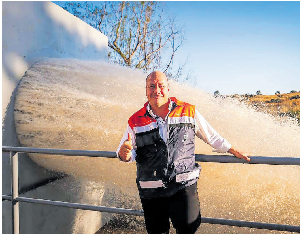
Línea 4 a Tlajomulco la deja muy avanzada, obra que impulsó.

"La Línea 4 del tren eléctrico de Tlajomulco va a convivir en términos ferroviarios con el tren de carga, es sin duda una de las apuestas más importantes que va a asentar las bases de un modelo que estoy seguro se va a llevar a muchas partes del país porque es de verdad difícil de entender cómo nunca en México se aprovechó lo que en Europa existe, en todos los países europeos, el poder aprovechar el derecho de vía del ferrocarril para tener también transporte de pasajeros, para ayudar a la movilidad de las ciudades y