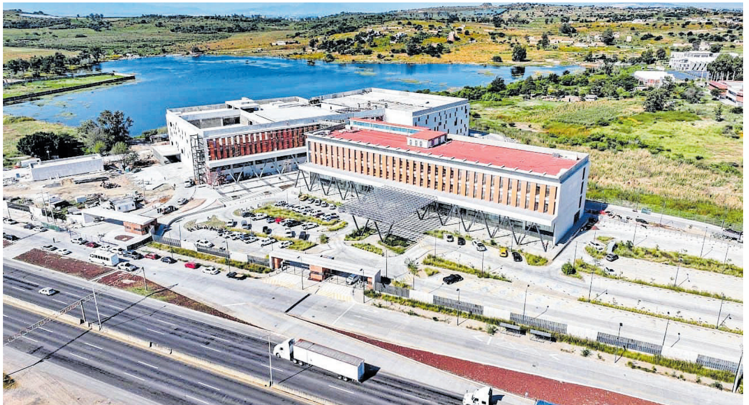
El Hospital Civil de Oriente y el puente de Ocotlán ya son una realidad para una población que ya lo requería.

En estos 6 años también se logró consolidar el mejor sistema de salud de México al garantizar la autonomía del estado en la prestación de servicios médicos a la población y no adherirse al extinto INSABI, lo que permitió la creación, reconstrucción o rehabilitación de centros de salud y hospitales regionales de primer mundo en todo el estado, así como su certificación, la implementación del programa de abasto de medicamentos por encima del 90%, la construcción de más hospitales de gran escala como Hospital Civil de Oriente, el Instituto Regional