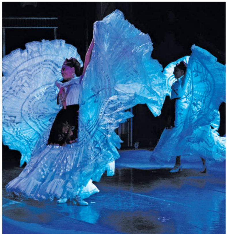
Cada presentación es un viaje por las distintas regiones del país.

La propuesta artística ha sido elogiada por su autenticidad y su capacidad para capturar el espíritu de la nación