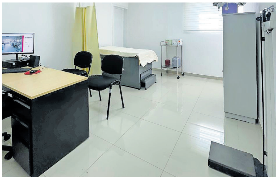
Centros de Salud fue una de las apuestas en la actual administración.

contra esta enfermedad, en Jalisco se tomó la decisión de establecer su propio modelo de medición, atención y proceso de vacunación, mientras se intentaba establecer una fórmula para poder adquirir vacunas de forma independiente al país.