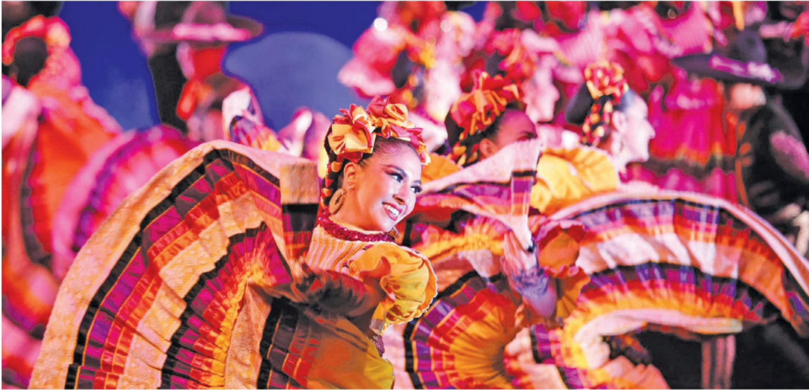
La nueva temporada ya inició con gran éxito en el Conjunto Santander de Artes Escénicas.