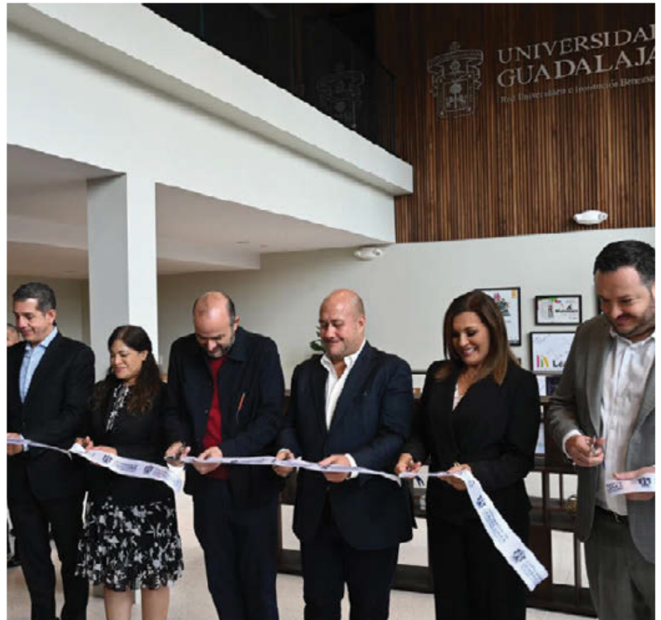
La nueva sede de la UdeG se ubica al interior de las instalaciones de la Arizona State University.