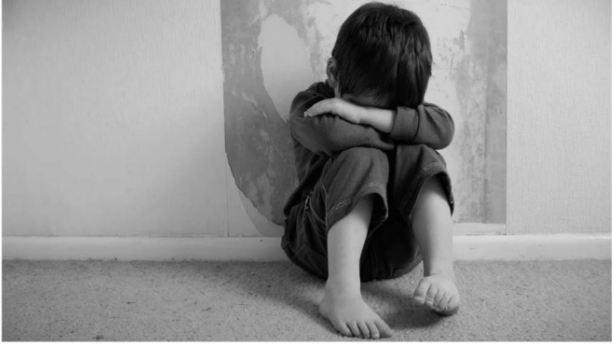
MILES DE CASOS. Entre 2018 y 2023 el abuso sexual infantil creció 58.76 por ciento

“Los datos muestran una baja tasa de identificación de agresores, lo que no solo impide la justicia para las víctimas, sino que también perpetúa un ciclo de impunidad. Este hecho es especialmente preocupante porque fomenta la continuidad del abuso al no disuadir a los potenciales agresores”.