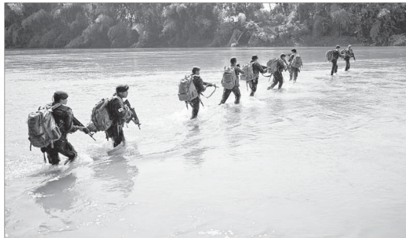
▲ Soldados del ejército guatemalteco patrullan la frontera frente a México, en el río Suchiate, como parte del plan Cinturón de