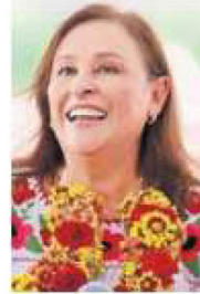
Rocío Nahle García

:::: Donde “están las cosas color de hormiga”, nos platican, es en Veracruz, pues la gobernadora electa, Rocío Nahle García (Morena) y los principales liderazgos morenistas estatales han venido subiendo el tono de sus protestas en contra, porque su partido arrojó al clan Yunes, encabezado por el panista Miguel Ángel Yunes Linares . Nos detallan que “un día sí y otro también” los morenistas critican a su partido por permitir que los senadores yunistas apoyen las reformas del ahora expresidente Andrés Manuel