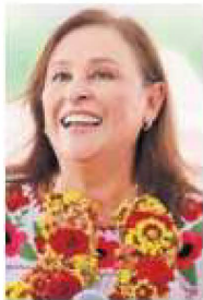
Rocío Nahle García

:::: Donde “están las cosas color de hormiga”, nos platican, es en Veracruz, pues la gobernadora electa, Rocío Nahle García (Morena) y los principales liderazgos morenistas estatales han venido subiendo el tono de sus protestas en contra, porque su partido arrojó al clan Yunes, encabezado por el panista Miguel Ángel Yunes Linares . Nos detallan que “un día sí y otro también” los morenistas critican a su partido por permitir que los senadores yunistas apoyen las reformas del ahora expresidente Andrés Manuel