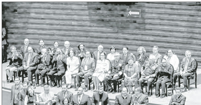
▲ El gabinete de Claudia Sheinbaum durante la sesión en el Congreso donde rindió protesta como Presidenta.

Twitter: @cafevega cfmexico_sa@hotmail.com