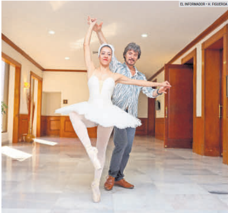
TALENTO. Bailarines que participan en el montaje “El Lago de los Cisnes”.

En cuanto a la producción de “El Lago de los Cisnes”, Velarca mencionó que son más de 50 bailarines en escena y un centenar de personas trabajando detrás del telón para hacer posible el espectáculo. “Son alrededor de unas 100