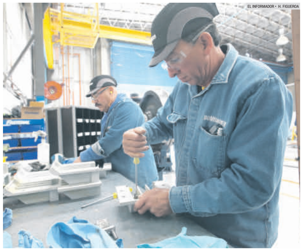
INDUSTRIA. Empresarios señalan que será necesario apoyo para el crecimiento económico.

Reconoció que la falta de una política industrial y de infraestructura provocó que México se vuelva menos competitivo.