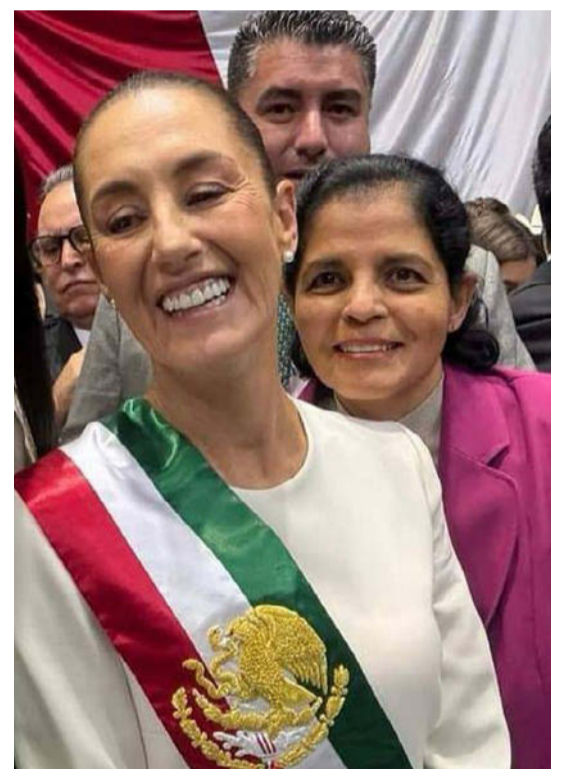
CORONA. La senadora María del Rocío Corona Nakamura dijo que se escribe un nuevo capítulo en la historia “que simboliza la victoria para todas las mujeres mexicanas”.