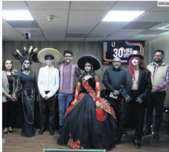
PRESENTACIÓN. Autoridades universitarias detallaron algunos de los eventos que podrán disfrutarse en las prepas de la UdeG.