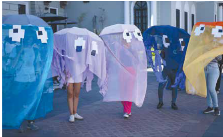
EN EL CENTRO. El Aquelarre 2024 concluyó en la Rambla Cataluña.

“Se (usaron) una gran cantidad de grúas, en esta ocasión tenemos siete grúas adornadas como carros alegóricos y dos automóviles decorados. Este año se volvió al origen de las brujas, precisamente se trata de cómo ese origen que nosotros tenemos dentro de la línea como curanderos, hechiceros, pues llegamos a este punto en donde ahora somos conocidos como farmacéuticos y químicos”, expuso