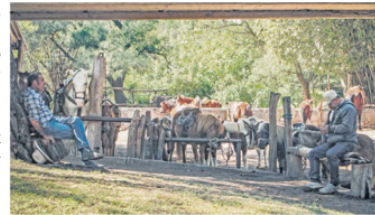
CABALLOS. Los caballerangos que realizan esta actividad brindan recorridos de media hora.