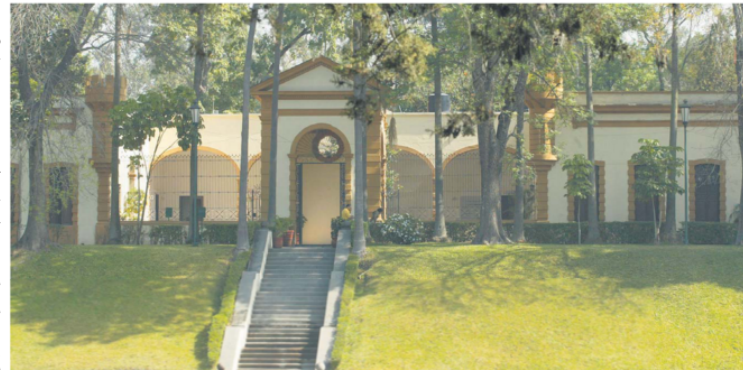
EL CASTILLO. Actualmente funciona como Casa de la Cultura, en donde se imparten clases de pintura, escultura y baile.