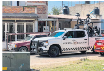
RECURRIDO DE LA GUARDIA NACIONAL. Vecinos de Tototlán confirman la presencia de los elementos, pero sin éxito: continúan los robos de combustible.

Tonalá es una de las zonas favoritas de los “huachicoleros”, al grado que los vecinos ven sin sorpresa las fugas que generan las tomas clandestinas en los ductos de Petróleos Mexicanos, como lo sucedió el pasado viernes, que provocó la evacuación de dos mil 100 vecinos.