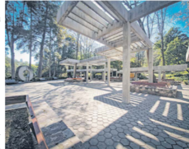
LAS PERGOLAS. Construida en 1974, esta explanada es una de las más conocidas dentro del bosque. Su arquitectura asemeja un laberinto.