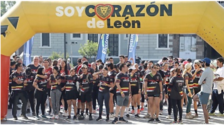
■ La carrera dio inicio a las 9:30 horas.