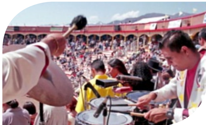
■ La tradición del toro de 11 es de los eventos principales del Carnaval de Autlán.

"No era contrario al espíritu del cristianismo, sino que más bien contraviene a la visión que se tiene del medioevo como una época de intransigencia religiosa, de moralidad recalcitrante, de persecución del pecador, pues no, se puede entender que el carnaval tenía esa finalidad: démosle al pueblo, al pueblo llano, la oportunidad de desfogarse, de sacar todos esos deseos concupiscentes y pecaminosos para que ya después desfogado, tuviera la oportunidad de meterse en esta otra dinámica religiosa,