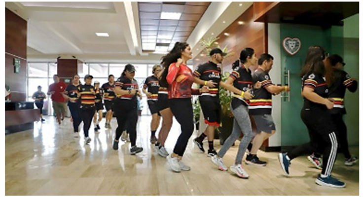
■ En su mayoría eran trabajadores administrativos.