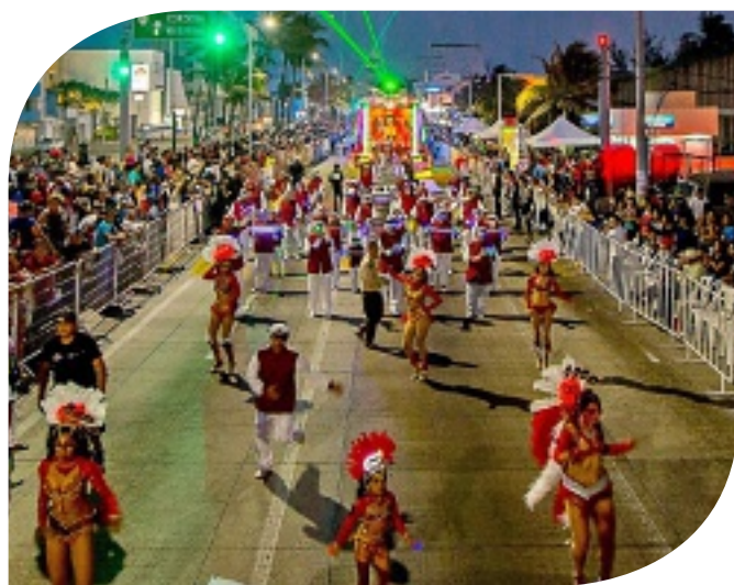
■ Uno de los carnavales más tradicionales de México es el de Veracruz.