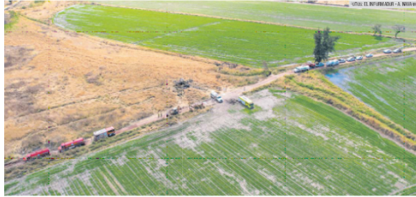
TOLOTLÁN. Las autoridades están reparando los daños causados por la fuga de combustible en el poblado de Tonalá.

Desde la llegada de López Obrador a la Presidencia se han incrementado las “ordeñas”