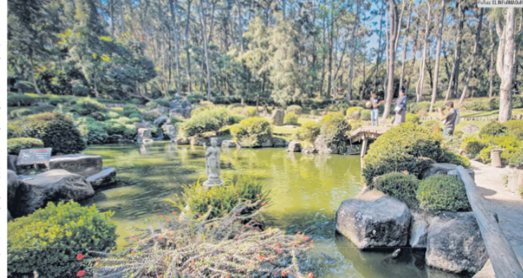
SESIONES FOTOGRAFICAS. El escenario ideal para esta actividad es el Jardín Japonés.