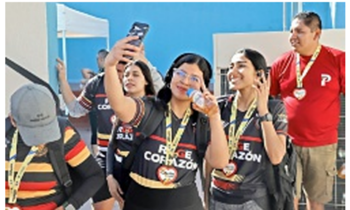
■ La meta estaba en la azotea.