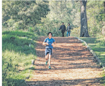
PISTA DE TROTE. Dividida en tres: una de 5 kilómetros y dos de 3 kilómetros.