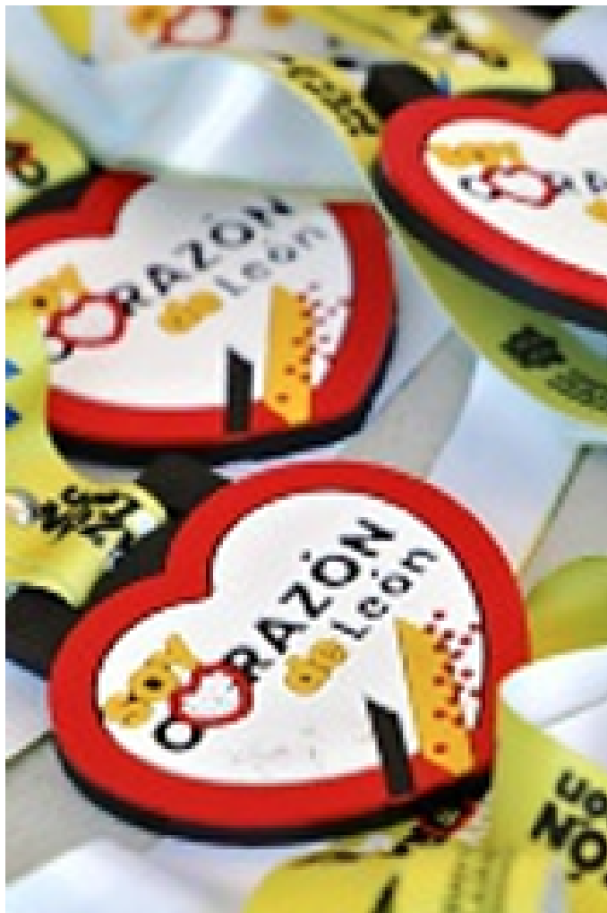
■ Les dieron medallas conmemorativas.