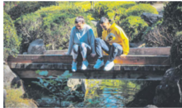
CURSOS DE VERANO. Tienen como fin la educación ambiental mediante juegos y retos.