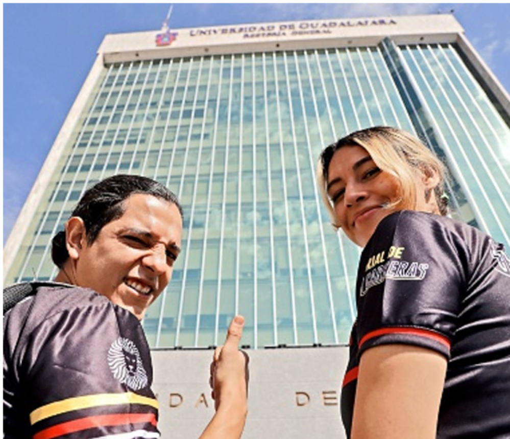
■ El evento se realizó en la Rectoría General de la UdeG.