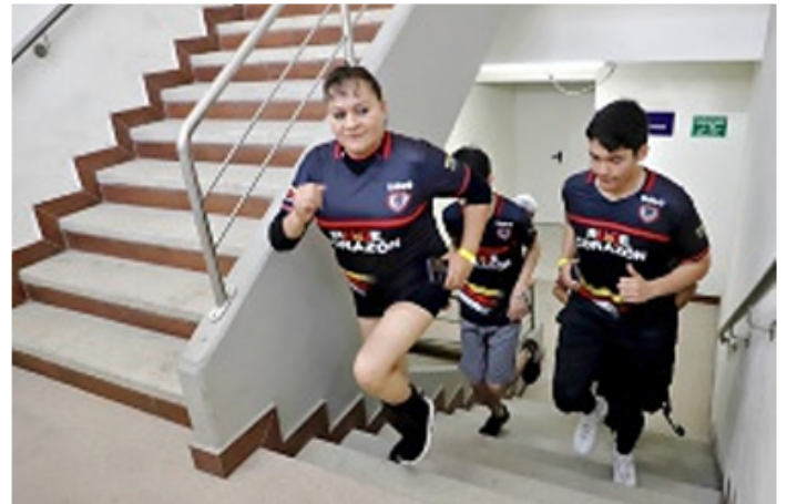
■ Debieron subir 13 pisos, en total 291 escalones.