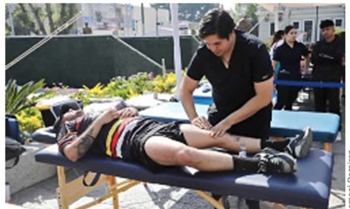
■ La atención médica no faltó.